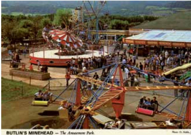
BUTLIN'S MINEHEAD — The Amusement Park.