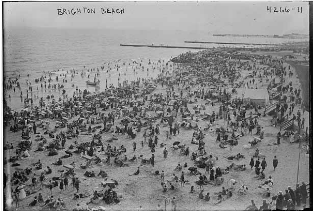
Brighton Beach, Brooklyn, New York, 1905.