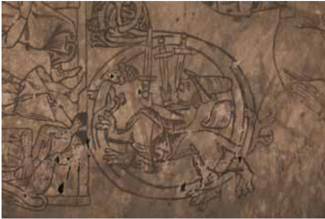
Figur 11 og 12 AM 673a III 4to, 18v og 19r.