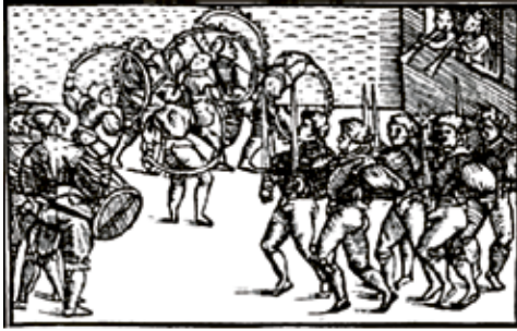
Fig. 1. Illustration fra Olaus Magnus' Nordenshistorie.

en kamp, og dels en gruppedans, hvor danserne danner en ring eller kæde ved hjælp af sværd. Når man taler om sværddans i dag, er det i de fleste tilfælde i den sidste betydning. 30