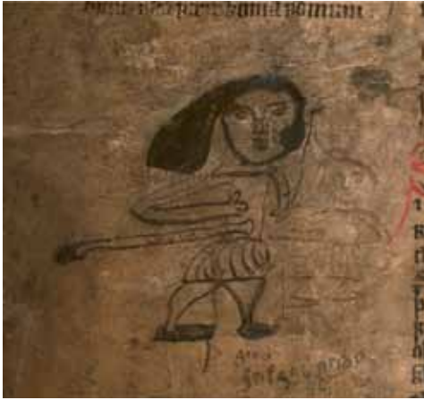
Figur 16. AM 347 fol., 94v.

fra 1400-tallet. 62 Håndskriftet befinder sig nu i Uppsala Universitets Bibliotek (Codex de la Gardie 11).