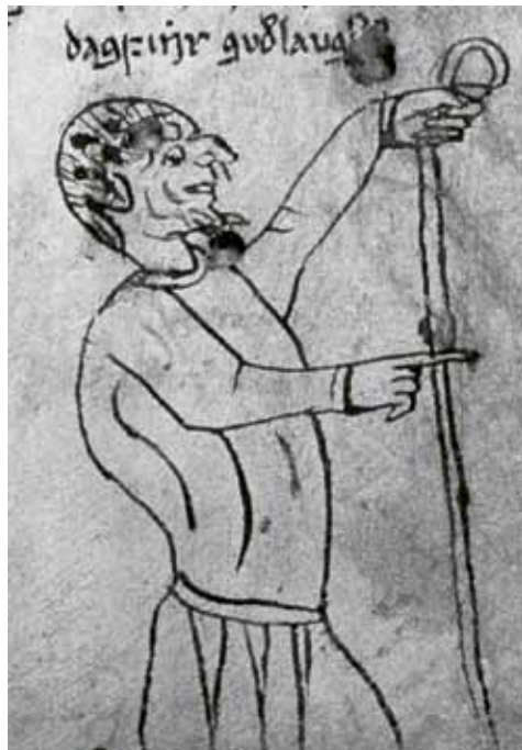
Figur 14-15.

til at være klædt i et skørt, der krøller sammen under hans jongleren (figur 13). 60 Som kuriosum kan nævnes, at der mange steder i beskrivelser af sværddans i yngre tid er en nar, der ledsager danserne. 61