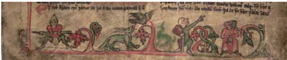
Figur 13. Gks 1005 fol., 5v.