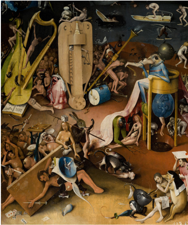
Djævel med gryde på hovedet indtager og udgyder sjæle. Udsnit af „Lysternes Have“ af Hieronymus Bosch. Museo del Prado, Madrid/Wikimedia Commons.

tager sanselighedens frugter, skal de selv blive indtaget af Djævelen og udgydt i latrinet. I denne skildring af en i sandhed obskøn indtagelse, hvor syndere ædes og transformeres til ekskrement, iscenesættes effektivt latrin som den monstrøse materialitet. 27