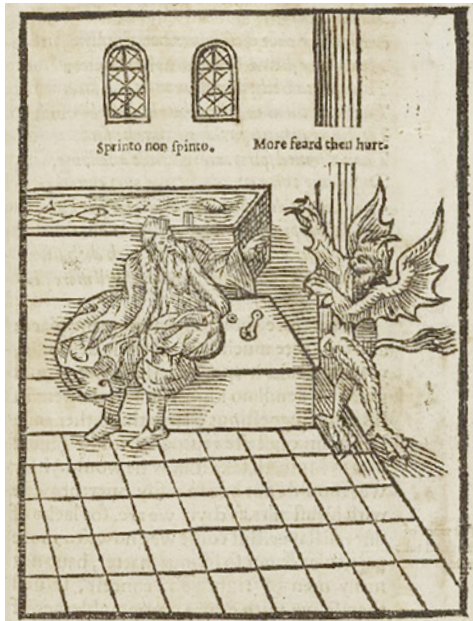
Djævelen på lokummet. Fra John Harrington „A new discussion of a stale subject“, 1596. Folgar Shakespeare Library, Washington.

spinkelt. Men komparation med det tilgængelige danske materiale fra urbane miljøer antyder dog en kronologisk udvikling, hvor de tidligmiddelalderlige latrinkonstruktioner anbringes tæt på det offentlige rum, i eller ganske nær på skelgrøfter og veje, mens de høj- og senmiddelalderlige latrinkonstruktioner konstrueres med henblik på afsondrethed fra offentligheden, på baggårdsområder, vendt væk fra vejforløb og bebyggelse. Dette fremgår af en arkæologisk undersøgelse fra den såkaldte Dagmargård i Ribe, hvor en række latrinkonstruktioner, dateret til 1100-tallet, er anbragt over et grøftsystem, der af udgraverne tolkes som skelgrøfter, og ganske tæt på et vejsystem. Samme placering ses på en samtidig udgravning i Nygade 10. 37 I Aalborg, hvor et større antal latrinkonstruktioner er berørt af arkæologiske undersøgelser, er senmiddelalderlige latrinkonstruktioner iagttaget på grundenes bagerste dele, dvs. en placeringsmæssig parallel til planløsningen i Guldsmedgade. 38