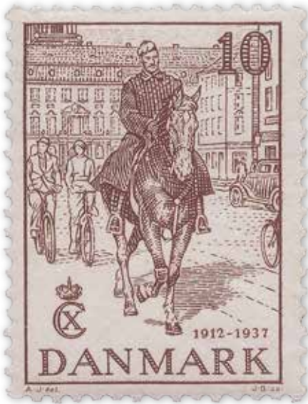
Ill. 10: Motiv fra serie udgivet i anledning af Christian X's 25 års regerings-jubilæum. PTM (dk-0240)