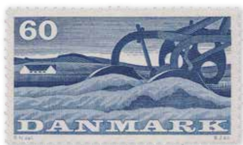
III. 5: Frimærke med landbrugsmotiv af Rasmus Nulleman, 1960. PTM (dk-0383)