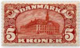
Ill. 2: Danmarks første særfrimærke, udgivet i 1912.