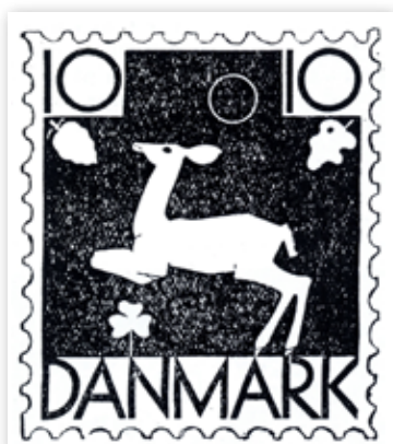
III. 6: Udkast til 10 øres frimærke med springende hjort fra Politikens frimærkekonkurrence, 1930. 57