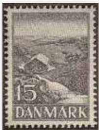
III. 15. Rebild nationalpark: Et af tegneren Knud Hovgaards bidrag til Berlingskes frimærkekonkurrence, 1937. 76