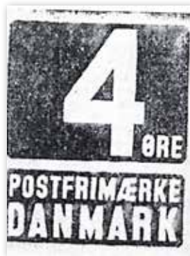
III. 20. Vinderen i Det Kraft'ske Legats konkurrence, 1936. 86