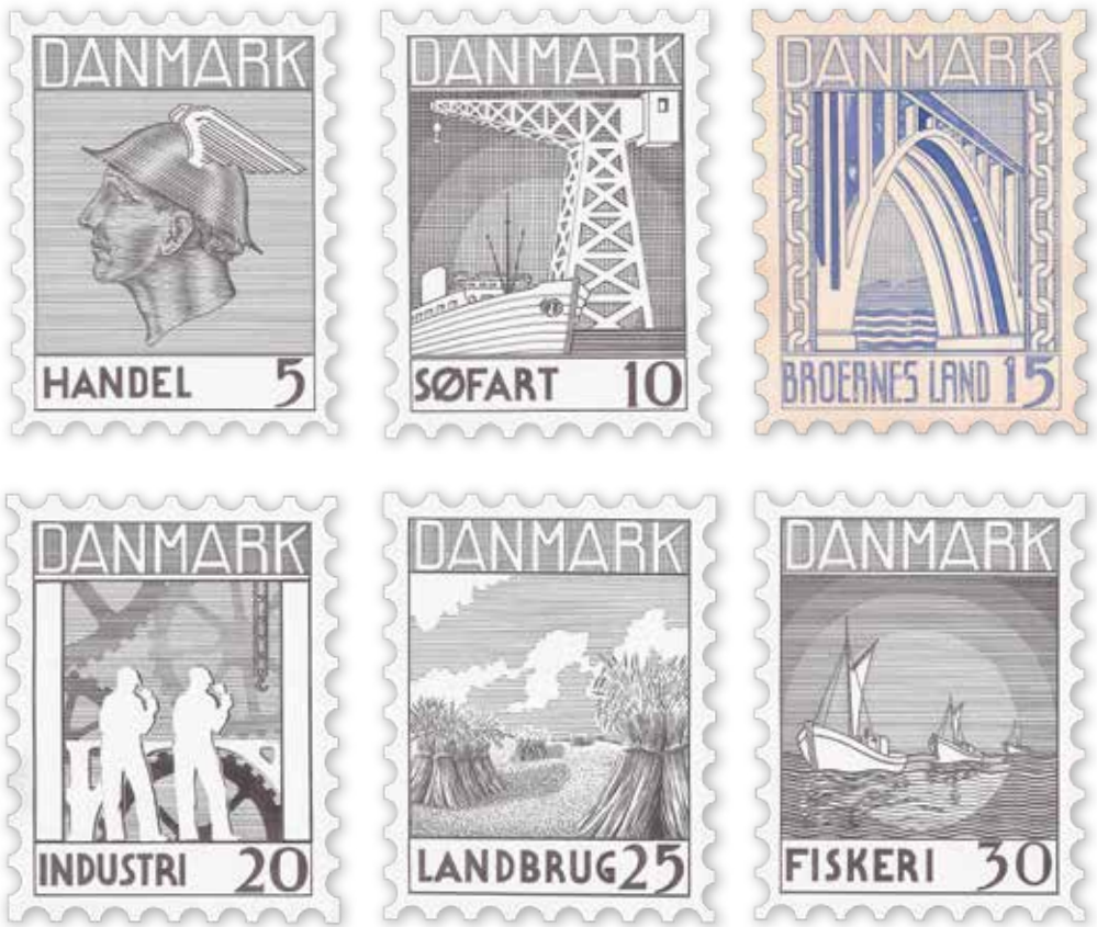
III. 14: Hagbard Friis Jensens art-deco-inspirerede bidrag i Berlingskes frimærkekonkurrence, 1937. 75