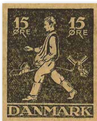
III. 7: Udkast til 15 øres frimærke med sående landmand fra Politikens frimærkekonkurrence, 1930. 58

lemanns Landbrugsmotiver fra 1960 og Fredningsserien, hvis første mærke udkom i 1962. 59