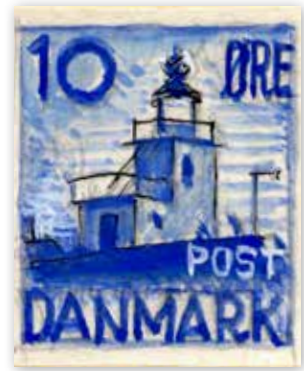
III. 19. Valdemar Setofts „tre danske motiver“, 1935. 85