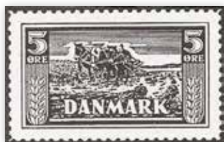
III. 4: Publikums vinder i Politikens frimærkekonkurrence, 1930: Poul E. Johansens forslag. 56