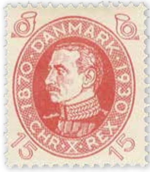
III. 1: Det udsældte kongefrimærke, udgivet i 1930. PTM (dk-0186) 2

1930 er „Protest mod de nye Kongefrimærker“ ( Politiken ); „De grimme frimærker bekæmpes“ ( Dagens Nyheder ); og „De hæslige ny Frimærker“ ( Lolland-Falsters Stiftstidende ). Aftenavisen B.T. var tilmed bekymret over, at kongefrimærket ville „bibringe Udlandet det Indtryk, at Danmark var et fattigt, forarmet Land“. 3 Ifølge B.T. var der brug for nye og mere turistegnede motiver, der tog udgangspunkt i det danske nationallandskab: „Og disse Frimærker gav paa ny Anledning til Krav om at faa Frimærker med udvalgte typiske danske Landskaber, der kan propagandere for vore Seværdigheder og lokke Turister til.“