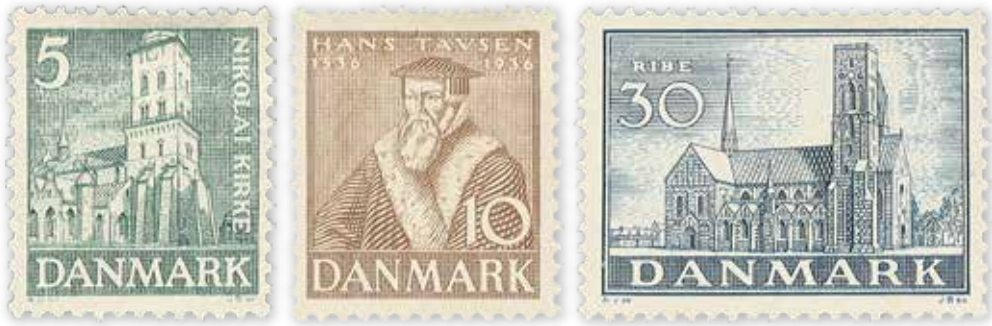
Ill. 3: Frimærkeserie udgivet i 1936, i anledning af 400-året for reformationen i Danmark. PTM (dk-0229, dk-0231 & dk-0233)