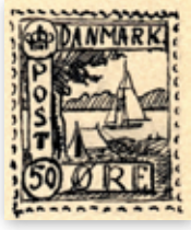
III. 17. Campingtur i det danske landsskab, 1935. 80