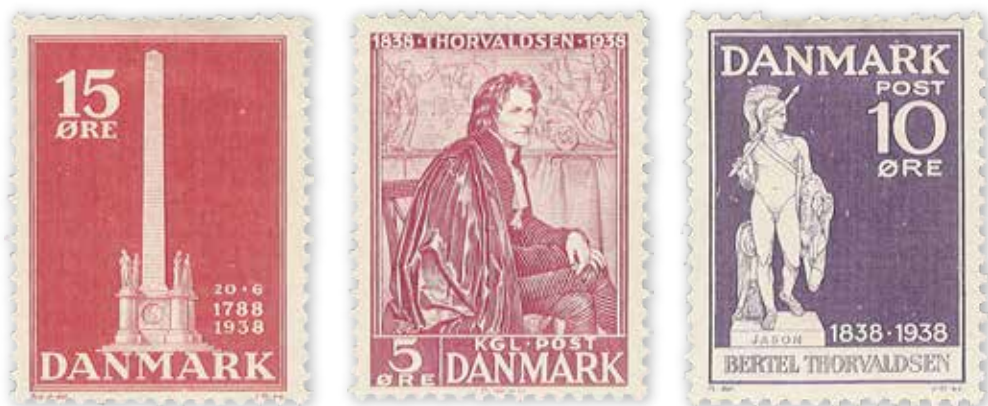
Ill. 22: Vinderne i Post- og Telegrafvæsenets åbne frimærkekonkurrence i 1938, udgivne som særfrimærker i samme år.