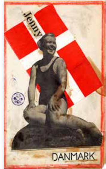
III. 18. „Forslag til et Jenny Frimærke“, 1937. 81