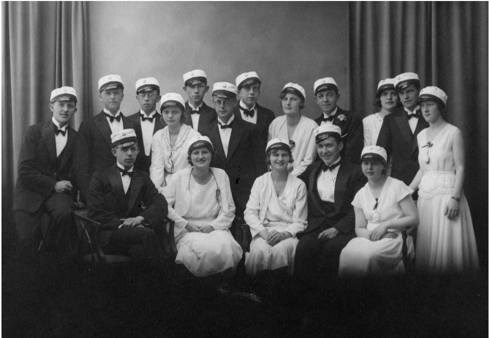
III. 5. Th. Langs Skolers nyudklækkede studenter samlet til billede i 1931.

1917-1935. I samme periode blev ca. 10% af alle drenge anbefalet videre studium, nemlig 18 elever. De fagligt dygtige drenge blev i højere grad direkte opfordret til videre læsning efter endt studentereksamen end de fagligt dygtige piger.