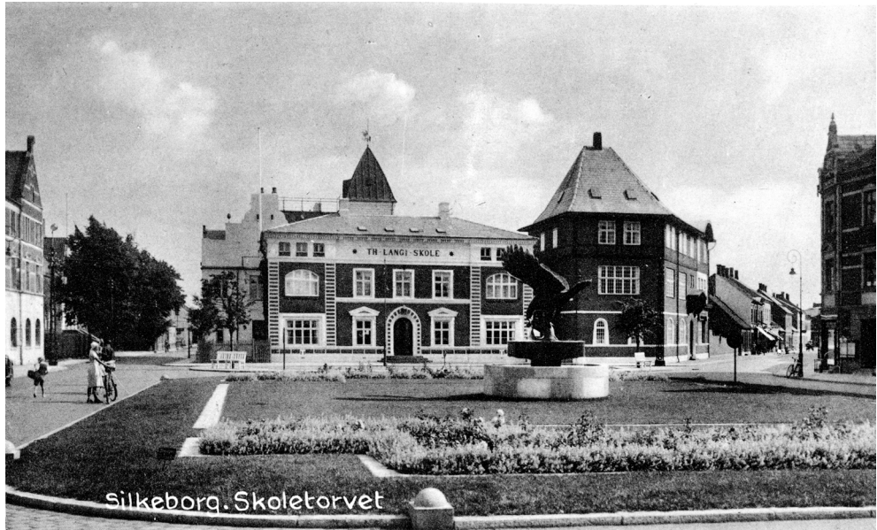
Ill. 1. Th. Langs Skoler set fra Skoletorvet ca. 1935. Bygningen, hvorpå der står Th. Langs Skole, blev opført i 1886, da skolen endnu var en pigeskole.