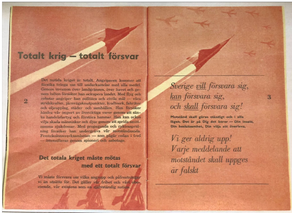
Den svenske pjece "Om kriget kommer" (1961), s. 2-3.

danske informationspjece deler titel med den samtidige svenske, og dele af indholdet fx om radioaktiv bestråling er relativt ens, mens ideen om familiebeskyttelsesrum, som indgår i den danske pjece, men ikke den svenske, er hentet fra USA. Den svenske og den danske pjece er samtidig meget forskellige i deres måde at henvende sig til offentligheden på. To citater kan illustrere denne forskel, først fra den svenske pjece: "Vi måsste försvara oss vilka angrepp och påfrestningar vi än utsätts för. Det gäller vår frihet och vårt oberoende, vår existens som en selvständig nation. Sverige vill försvara sig, kan försvara sig, och skall försvara sig! Motstånd skall göras städigt och i alla lägen. Det är på Dig det beror – Din insats, Din beslutsamhet, Din vilja at overleva." 15