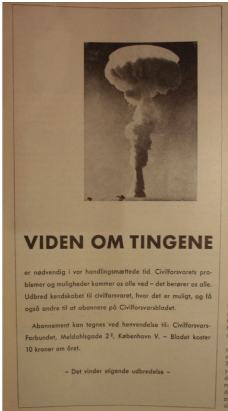
Civilforsvarsbladet nr. 3, 1963, s. 14. Annoncen blev brugt over en længere periode i Civilforsvarsbladet.

samtidig, som vi har argumenteret for i denne artikel, spørgsmålet om hvilken historisk kontekst vi skal se konstruktionen af den ideelle atomalderborger i, hvis vi skal analysere den i et bredere kulturhistorisk perspektiv.