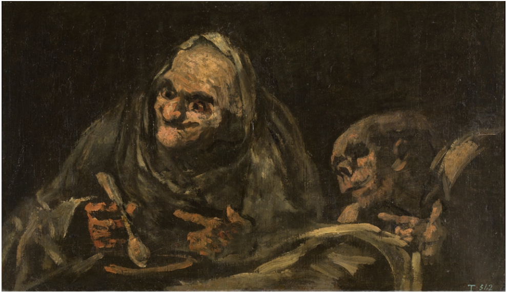
Illustration 2. I kunsthistorien er gamle mennesker ofte portrætteret som uhyggelige og afskyelige. Her er det Goya med maleriet 'To gamle mænd spiser suppe', 1819-1823.