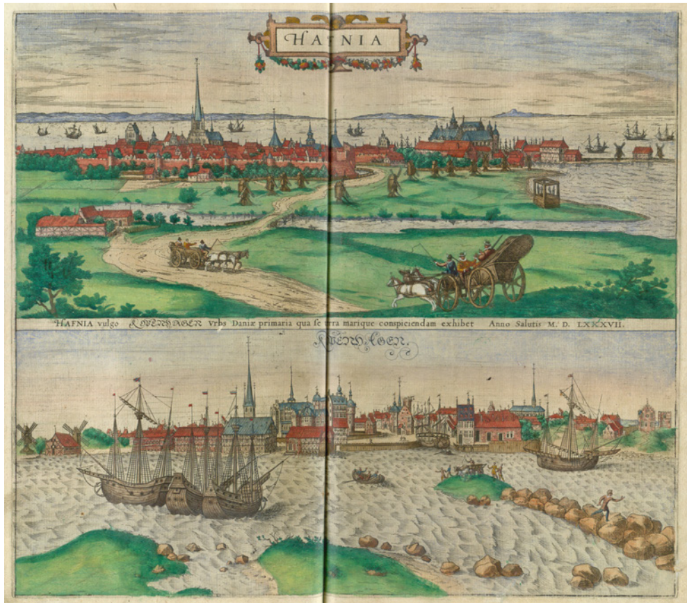
Koloreret kobberstiksprospekt af København fra 1587 i Georg Brauns og Franz Hogenbergs Civitates orbis terrarum. Øverst ses byen omtrent fra Valby Bakke, nederst fra søsiden. Der er tale om en idealiseret gengivelse af byen på Frederik 2.s tid.