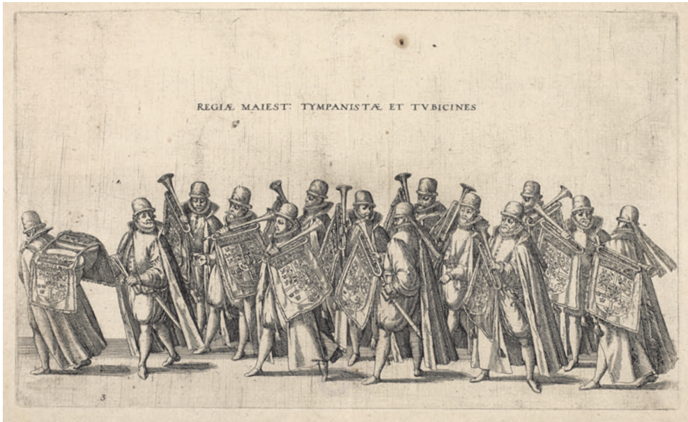
Kobberstik af Paukeslagere og trompetere fra Frederik 2.s musikkorps, som gik med i kongens ligtog i Roskilde 5. juni 1588. Modsat i kroningsoptoget næsten 30 år tidligere spillede musikanterne ikke på deres instrumenter under begravelsesoptoget. Kobberstik fra Hogenbergs og Novellanus' 21 kobberstik af ligtoget.

lydene fra den kongelige fest dog være overdøvet af de festligheder, der samtidig foregik rundt omkring i byen.