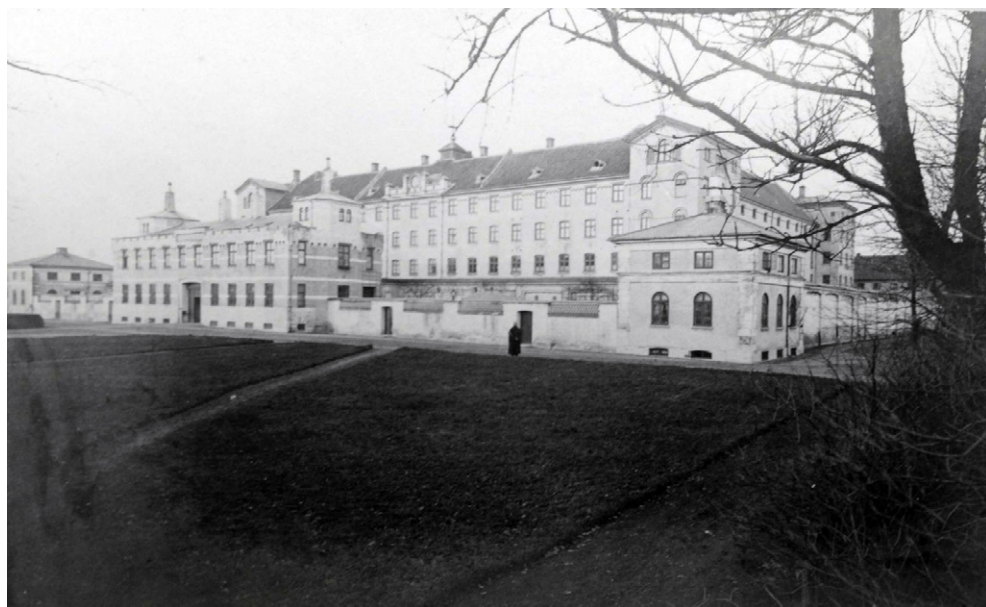
Billedtekst: Horsens Straffeanstalt set fra sydøst.

sammen udgør dette kildemateriale en unik mulighed for at undersøge fangernes sociale liv og i særdeleshed den måde, hvorpå fangerne knyttede kontakter til verden uden for ringmuren. 12