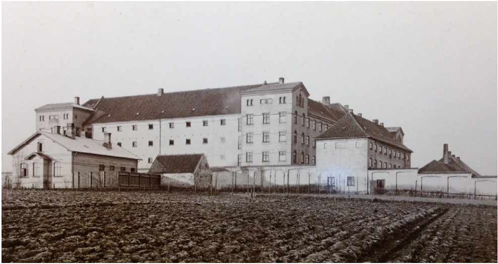
Horsens Straffeanstalt set fra øst.