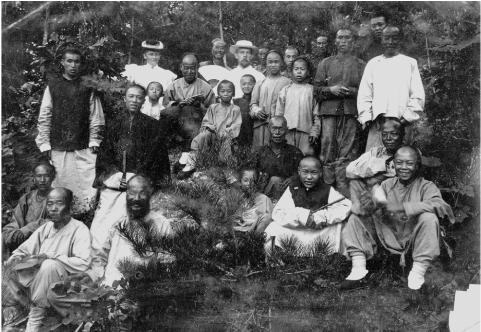
Conrad Sophus Bolwig, der leverede modeller af kinesiske fiskeredskaber til Etnografisk Samling var dansk missionær i Kina fra 1893 til 1946.