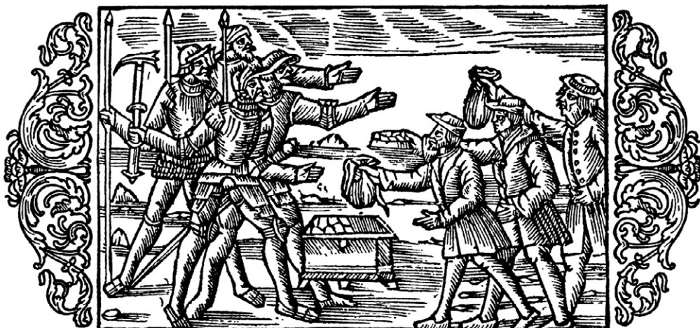
Olaus Magnus: Historia de Gentibus Septentrionalibus, bog 8, kap. 27.

Olaus Magnus' billedtekst lyder: "De tyrannica feueriate & eactione præfactorum" [Om fogedernes hårdhed og udnyttelse (egen oversættelse)]. Man skal selvfølgelig være kritisk over for Olaus Magnus' udsagn, da han havde en tydelig politisk-polemisk dagsorden og hertil desuden ikke illustrerede hverdagens skatteopkrævning, men derimod de danske embedsmænd under Erik af Pommern. Disse er berygtede for deres hårde fremfærd, som blev legitimeret af et akut behov for penge til at dække udgifterne fra Kong Eriks krig med Holstenerne, 1416–1423 og 1426–1436. Den hårde beskatning foranledigede store protester i Sverige og mundede bl.a. ud i Engelbrektovrøret. 10 Til trods for disse forbehold står én pointe dog tilbage: Skatteinddrivning var ikke altid lige nemt og kunne i praksis afføde alvorlige konflikter.