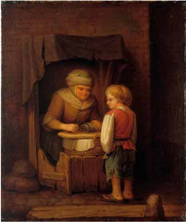
Figur 1. Kvinde sælger pølseskiver fra bod. Omkring 1780. Peter Cramer. Københavns Museum.

ham også vist, at hun ikke var en dårlig mor, idet man „kan spoere den Moderlige Kiærlighed, da hun ey kunde taale at lade det omkomme af Hunger“. Desuden havde hun sat barnet et sted, hvor hun ville blive fundet hurtigt. Og Karen var heller ikke så udsat som et spædbarn, fordi hun både kunne gå og tale.