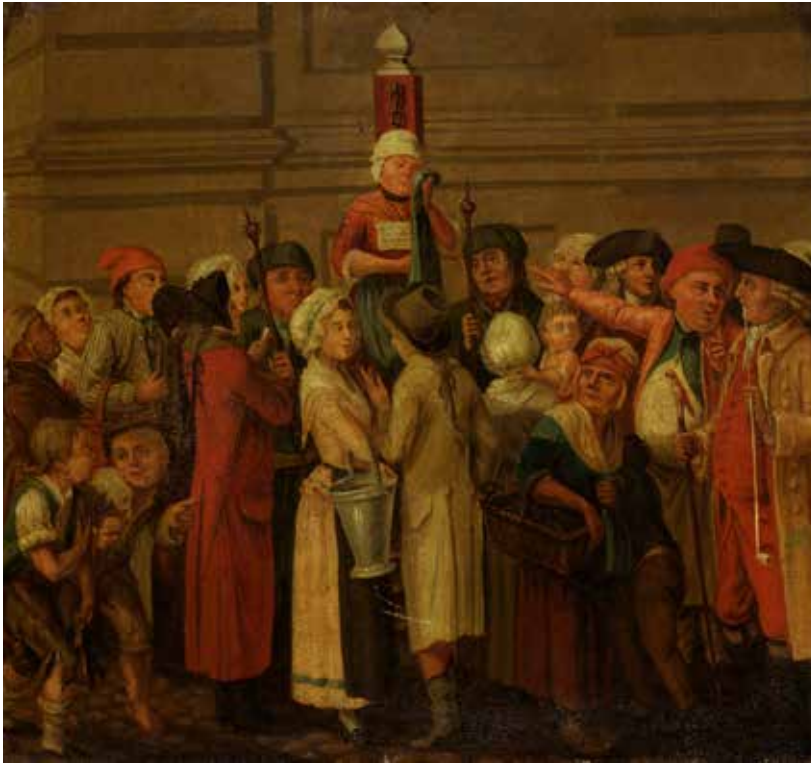
Figur 2. Kvinder kunne også blive offentligt afstraffede. Her ses kvinde ved kagen. Ukendt kunstner. Ca.1780. Københavns Museum.

haves Hensigt, er bedre tjent, end ved for en lang Leve Tid at leve et ulykkeligt og æresløst Levned“. 45