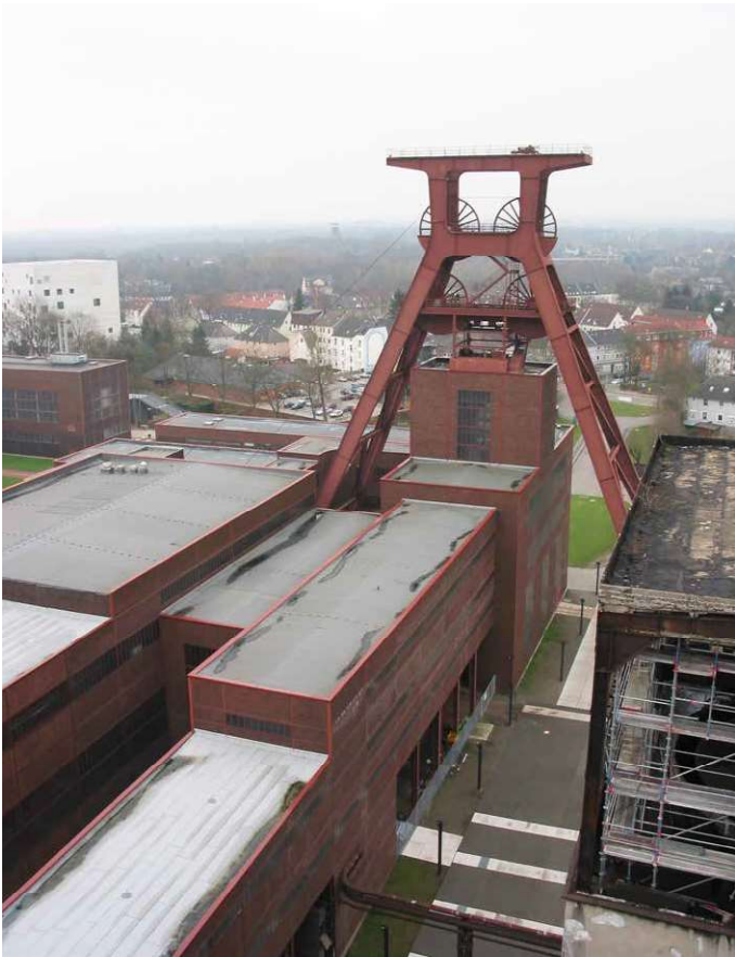
Zollverein kulmine og industrikompleks i Ruhr-området er i dag erklæret for Unesco verdensarv. Foto Caspar Jørgensen 2007.

dannelse som en konstrueret størrelse. 66 I modsætning til klassisk nationalismeforskning inddrager de to forfattere imidlertid regionen i deres analyse af identitet, fordi de mener, at den regionale geografi er afgørende for at forstå, hvorfor den industrielle kulturarv opstår. I modsætning til nationer har regioner ofte et begrænset historisk repertoire til disposition, når de skal skabe deres identitet, hvilket tvinger de industrielle regioner til at fokusere på industri som deres kulturarv. 67