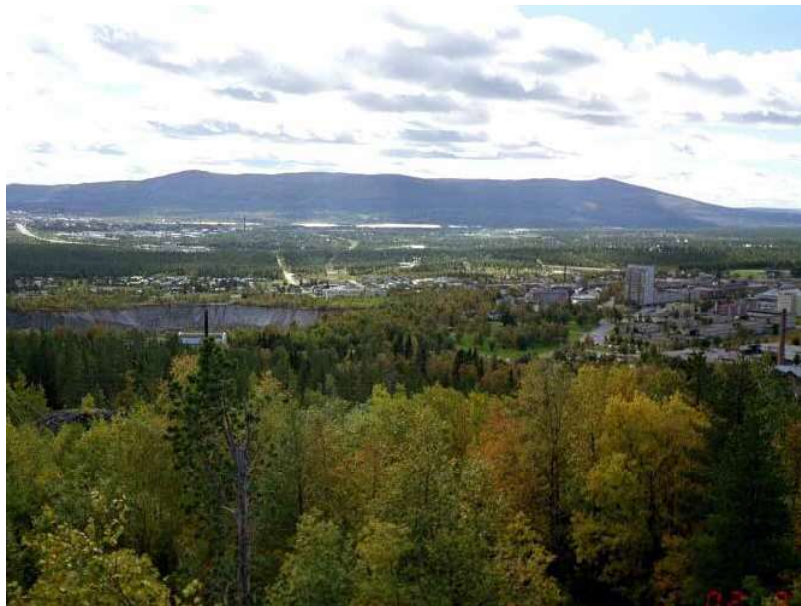
Malmberget minelandskab er en af Sveriges største fungerende miner.