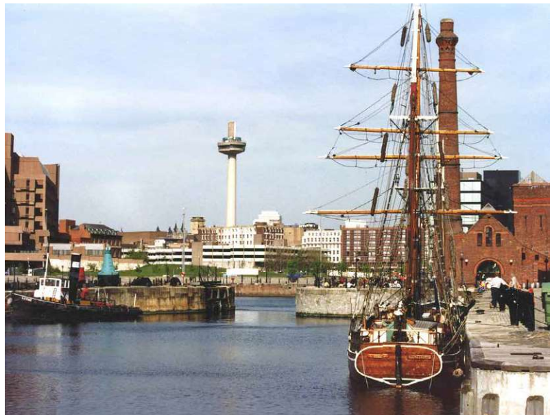
Liverpool havn i 1993. Liverpool fik frataget sin status som Unesco verdensarv i 2021, efter at havnens industrielle særtegn var forsvundet i forbindelse med byudvikling af havnen.