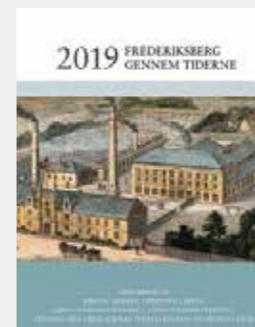
Frederiksberg Gennem Tiderne 2019, bd. 42. udgivet af Historisk-Topografisk Selskab for Frederiksberg. III. 312 sider. ISBN 978-87-87477-45-1.