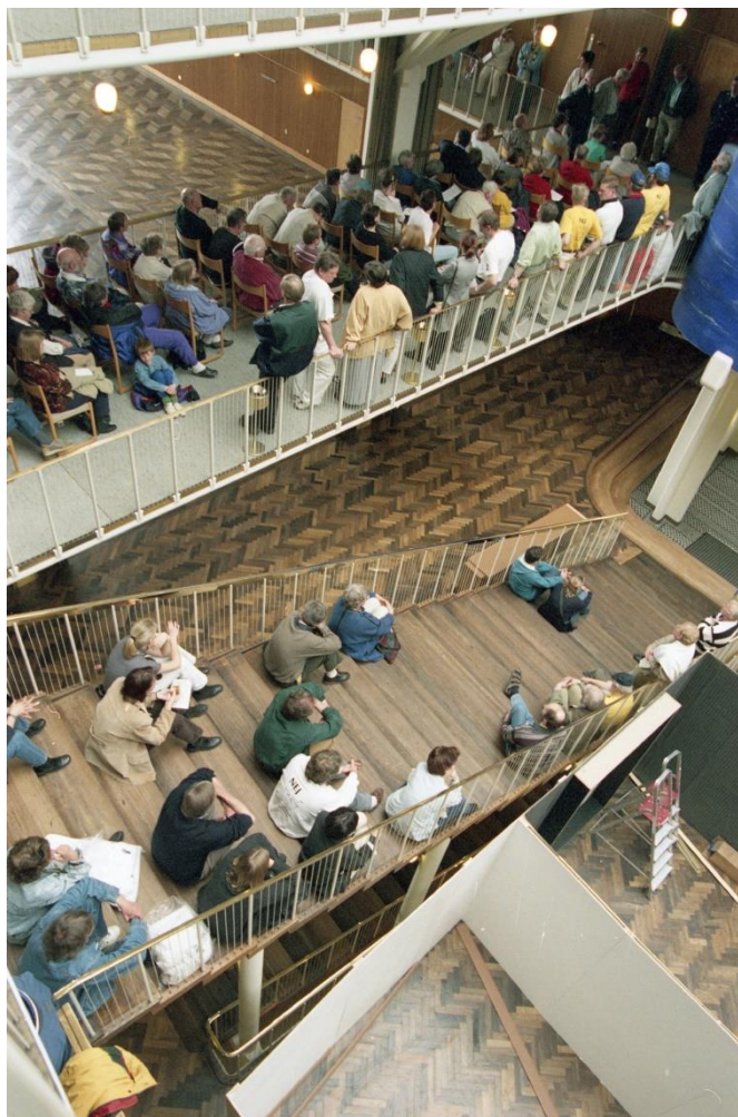
Debatmøde om lufthavnsplanerne på Aarhus Rådhus 1999.

Samme dag fik Danmark også en ny trafikminister i form af Sonja Mikkelsen (A). Den nye minister åbnede få dage senere noget overraskende op for, at hendes ministerium gerne ville bidrage med ekspertise til at lave ”de nødvendige beregninger i [lufthavns-] projektet”. Sonja Mikkelsen tilføjede derudover, at hun ikke ville stå i vejen for en ny lufthavn i Østjylland, men samtidig fastholdt hun, at der ikke kunne blive tale om statslig støtte til den ny lufthavn. Endvidere fastslog ministeren, at en ny lufthavn ville få alvorlige konsekvenser for de øvrige nærliggende lufthavne i Jylland, og at ”man derfor bliver nødt til at inddrage dem i processen”. Ministeren ville dog ikke gå ind i sagen, med mindre der kom en stor gruppe af interessenter, der ville have trafikministeriet til at finde en fælles løsning. 103 Samtidig gav Horsens Erhvervsråd deres mening til kende i lufthavnsdebatten, idet rådets formand, Direktør Leif Hede Nielsen, bekendtgjorde, at de bakkede op om Billund Lufthavn som regionens lufthavn. Erhvervsrådet baserede sin argumentation på Billund Lufthavns succes og de økonomiske udgifter forbundet med etableringen af en ny lufthavn ved Aarhus. 104 Kort forinden havde erhvervsrådet i Skanderborg til gengæld meldt ud, at det gav sin fulde opbakning til etableringen af en ny lufthavn ved Aarhus. 105