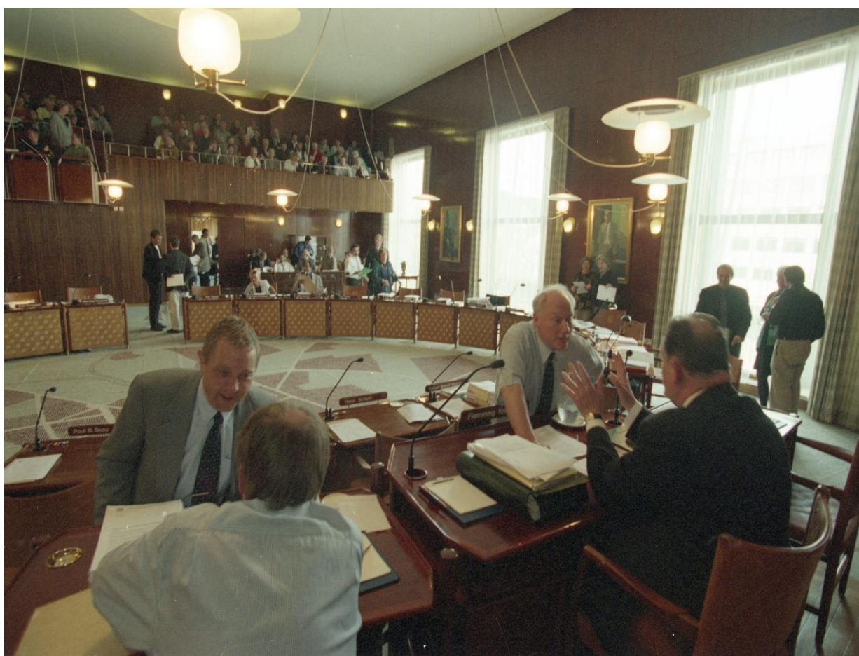
Byrådssalen i Aarhus i forbindelse med åbent debatmøde om lufthavnsplanerne 1999.

I forbindelse med ansøgningsspørgsmålet stillede Århus Stiftstidende skarpt på den juridiske proces omkring etableringen af en ny lufthavn. I den forbindelse informerede Trafikministeriet om, at en ny lufthavn krævede tre tilladelser. De to af dem var baseret på luftfartsloven og skulle gives af Trafikministeriet. Den tredje var efter plan- og miljølovgivningen og skulle komme fra Miljøministeriet og fra amtet, idet sidstnævnte var regionplanmyndighed. Hvad angik ansøgeren, så slog kontorchef i Trafikministeriet Niels Remmer fast, at alle principielt kunne søge så længe, der kunne dokumenteres ”seriøsitet og penge bag projektet”. 167 Kontorchefen fastslog endvidere, at en ny lufthavn ville blive vurderet ud fra en helhedsvurdering, hvor Billund, Karup og Tirstrup Lufthavne skulle inddrages. Man ville vurdere en ny lufthavns ”konsekvenser for den trafikale helhed i landsdelen”. 168 I forbindelse med afdækningen af den juridiske proces skrev Stiftstidende derfor, at amtet havde fat i den lange ende, da det bare kunne afvise at godkende en ny lufthavn – til trods for, at Trafikministeriet og Miljøministeriet eventuelt ville godkende en ansøgning. 169 Dette var principielt rigtigt, men det politiske pres på amtet kunne også blive så stort, at amtet ville få mere end svært ved at afslå ansøgningen, med mindre der lå usædvanligt gode miljøargumenter bag afslaget.