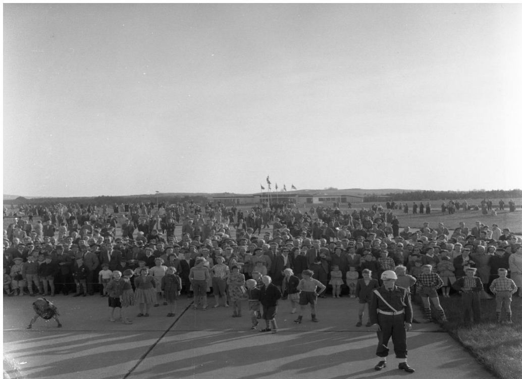
Menneskemængde ved landingsbane, Tirstrup Lufthavn 1955.