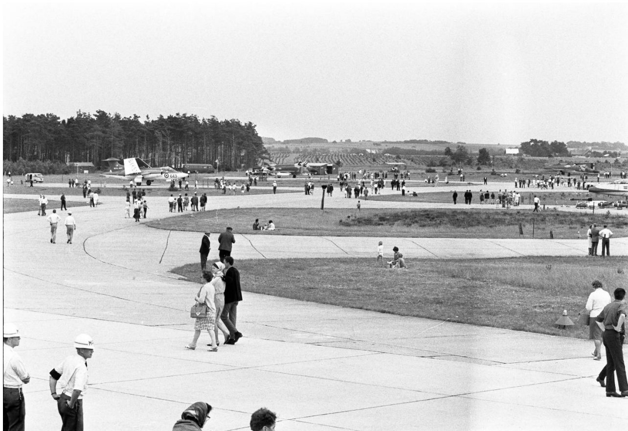
Åbent hus i Tirstrup Lufthavn, 1966.