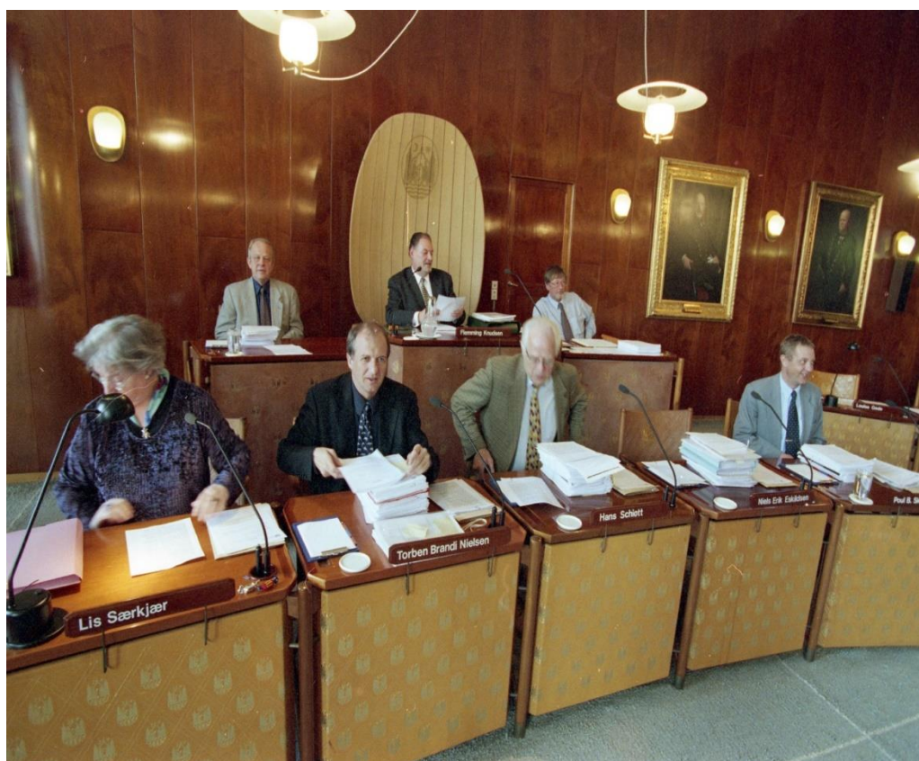
Byrådssalen i Aarhus 1999, debatmøde om lufthavnsplanerne.