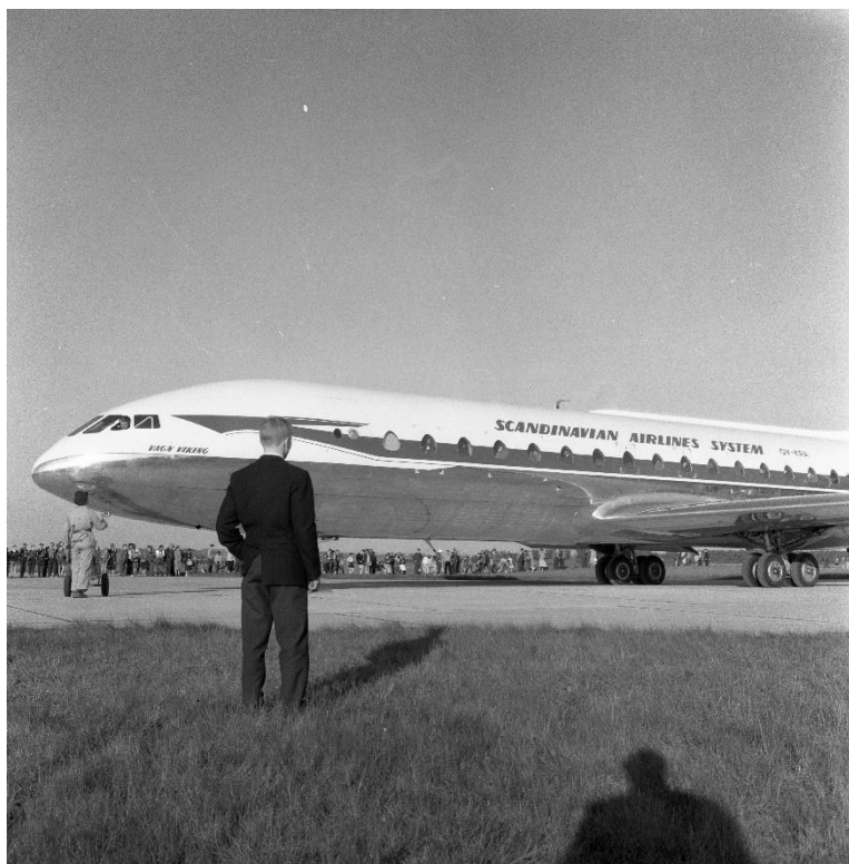
Caravelle jet ved Tirstrup Lufthavn, 1966.