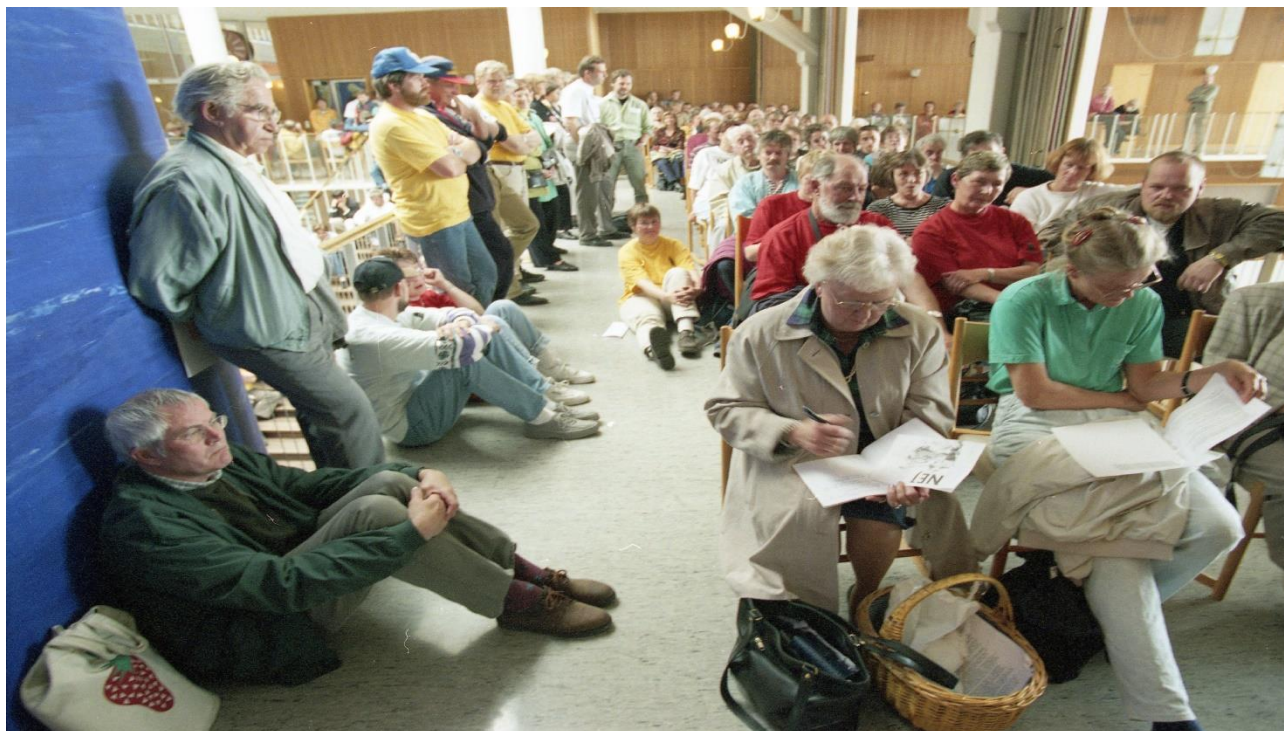
Debatmøde omkring lufthavnsplanerne på Aarhus Rådhus 1999.