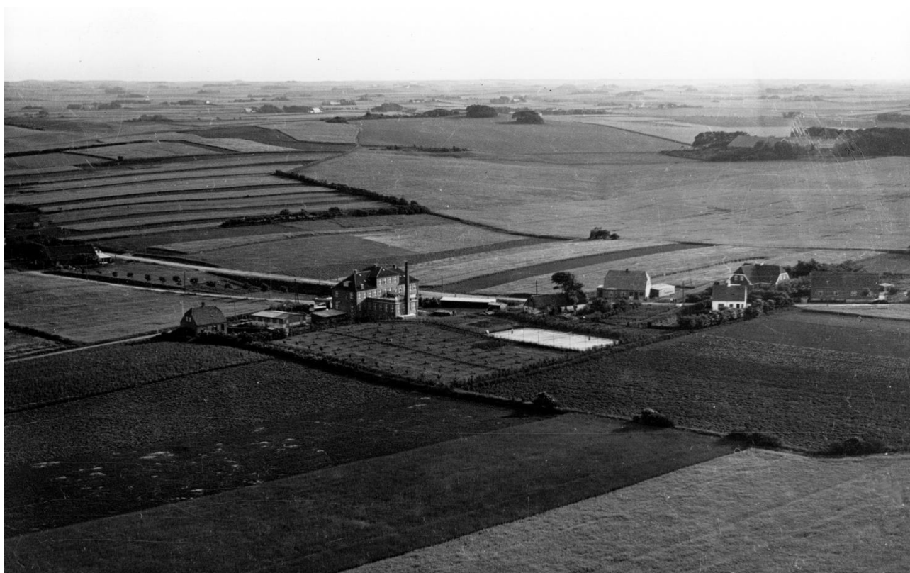
Bang & Olufsens første fabrik fra 1927. Fabrikken blev sprængt ved schalburgtage i 1945, hvorefter en ny fabrik blev bygget på samme grund.

B&O byggede sin første fabrik i 1927 lige syd for kommunegrænsen med Struer Købstadskommune mod nord og landkommunen Gimsing mod syd. Et par år forinden havde de to unge ingeniører Svend Olufsen og Peter Bang startet deres virksomhed på familien Olufsens gods, Quistrup, men deres foretagende voksede sig hurtigt for stort til loftsværelset på ejendommen. Den første fabrik lå for sig selv omgivet af marker, men fik snart selskab af enkelte beboelsesejendomme i området. Grundlaget for et boligkvarter i Gimsing blev lagt med den første radiofabriks grundsten.