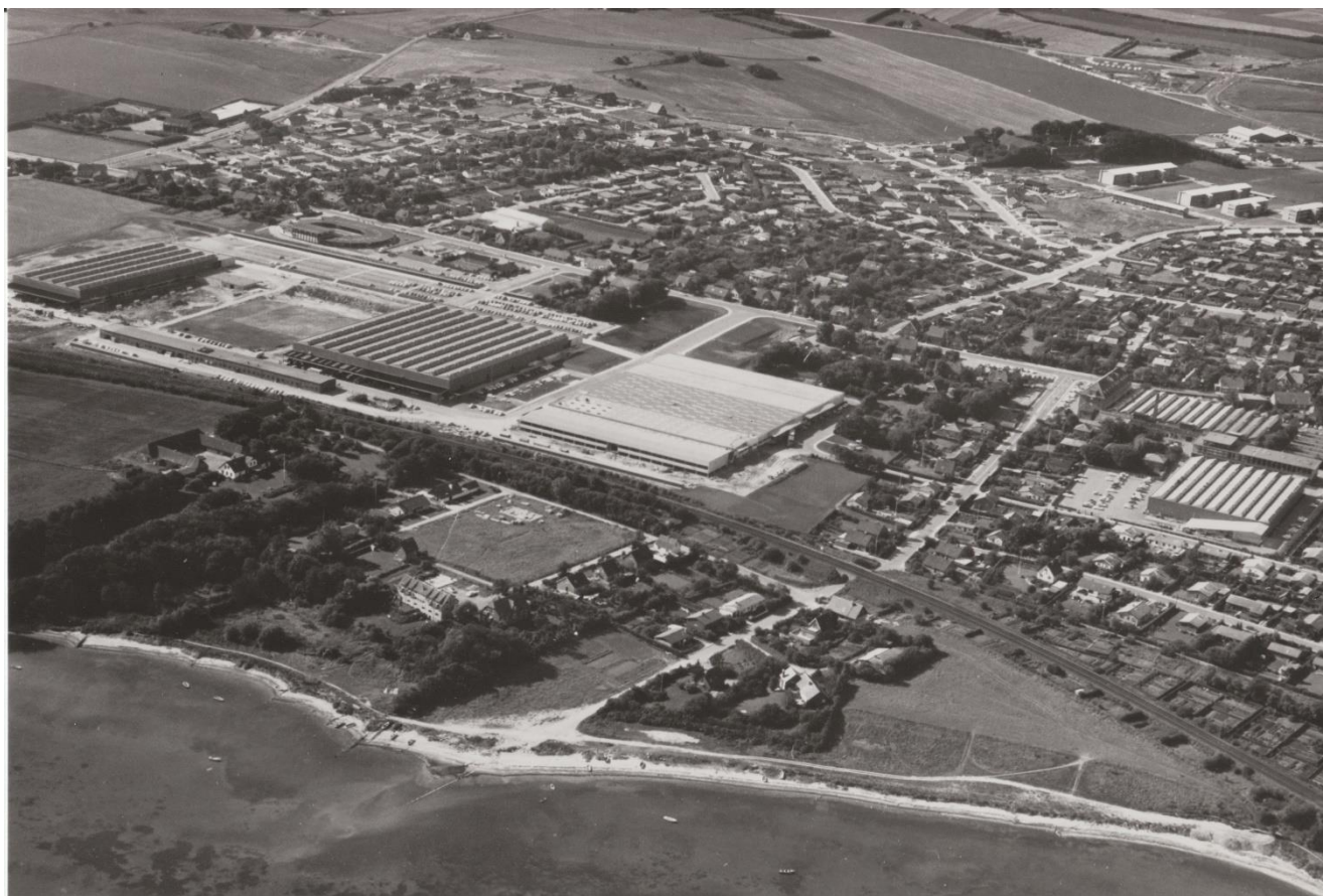
Luftfoto over Gimsing og fabrikkerne, 1972.

B&O-byen var altså ligesom andre moderne fabriksbyer præget af den øvrige byudvikling – også i langt højere grad end de tre områder, som jeg sammenligner med senere – og særligt i tiden efter kommunalreformen smeltede området sammen med resten af Struer. Det var også langt fra udelukkende B&O-medarbejdere og deres familier, der bosatte sig i Gimsing, selvom koncentrationen var stor. Udviklingen i B&O-byen handlede i høj grad om lokale kommuner som aktive parter, om parcelhusudviklingen som en kontekst på nationalt plan og om en planlægningsstruktur, hvor udstykninger og behovet for boliger fulgte hinanden løbende. Bydannelsen var ikke et udtænkt og på forhånd planlagt projekt på tegnebrættet som andre lignede bebyggelser ved og af virksomheder. B&O har ikke spillet en stor rolle i udviklingen af området, og relationen mellem fabrik og by må derfor afsøges andetsteds.