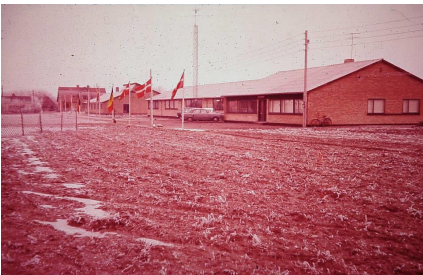
Fjernsynsfabrikken i Pandrup blev i 1958 bygget i lyn tempo, "Pandrup-tempo". Øverst ses Falck, der hjalp med at montere gitterspærerne. I midten ses håndværkere og investorer, der andægtigt lytter til sognerådsformandens ved rejsegildet, og nederst ses fabrikken med flagalle ved indvielsen.