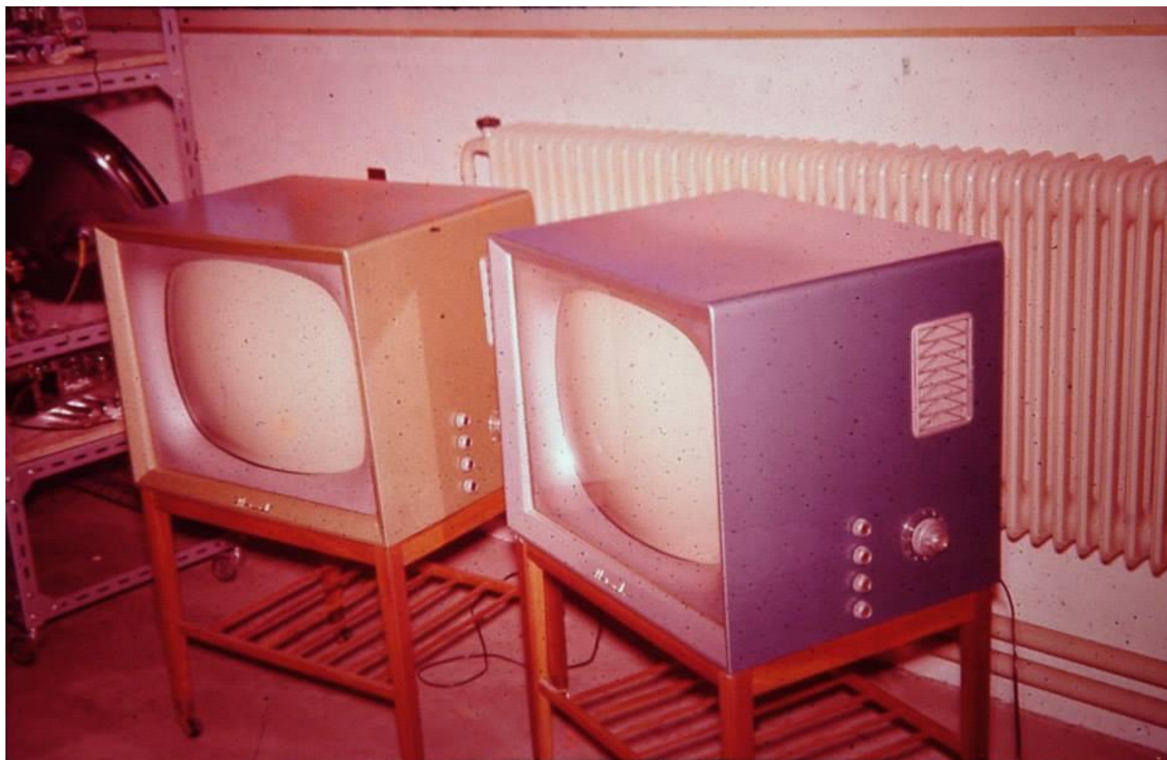
Færdige AREL tv-apparater fra Tepanco fjernsynsfabrikken i Pandrup.