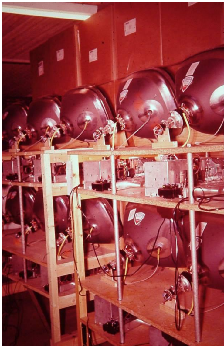
Som et led i den grundige kvalitetskontrol indgik alle billedrør i en grundig praktisk afprøvning inden monteringen. Her prøvestanden for afprøvningen.