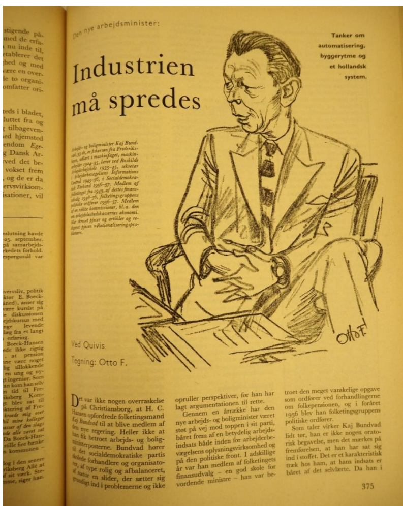
Kaj Bundvad var nok den minister, der tog problemerne med arbejdsløshedens problem mest alvorligt. Her første side med interviewet med ham i Arbejdsgiveren 1. oktober 1957.

Og hvordan gik det så familierne der flyttedes til Ballerup. Fra at have været tvunget til at ernære en familie på 6 personer de 10 af årets måneder, med kun 92 kr. om måneden i understøttelse, var der nu mad i gryderne hver dag. Man kunne begynde at spare sammen til nye møbler, og måske drømme om et pænt vendetæppe på gulvet. Men på arbejdspladsen var vores folk ikke så populære. Bare det at de havde fået lejlighed ved at springe over ventelisten på 300, hvoraf mange havde ventet i evigheder, og det kneb også lidt med at blive enige om hvordan akkordaftalerne skulle forstås. Inden der var gået 2 år, var de første 2 familier flyttet tilbage; man havde ikke kunnet finde sig selv derovre i storbyen. Livet er ikke kun et spørgsmål om boligstandard og timeløn. Kaj Bundvad der nu havde overtaget Arbejdsministeriet slår da også fast i et interview i bladet Arbejdsgiveren den 1. oktober 1957, at løsningen på arbejdsløshedens problem ikke ligger i en flytning af arbejdskraften, men i en politik, der placerer industrien der, hvor arbejdskraften er til stede.