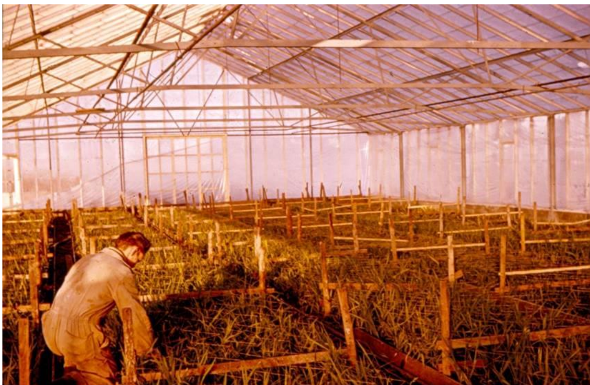
Drivhusgartneriet ved Søkær kom op at stå i rekordfart på trods af jordlovsudvalgets formand, der dengang endnu foretrak ledig landbrugsjord anvendt til statshusmandsbrug. Øverst ses varmecentralen og nederst drivhus med fresa-kulturer. Privatfotos 1957.