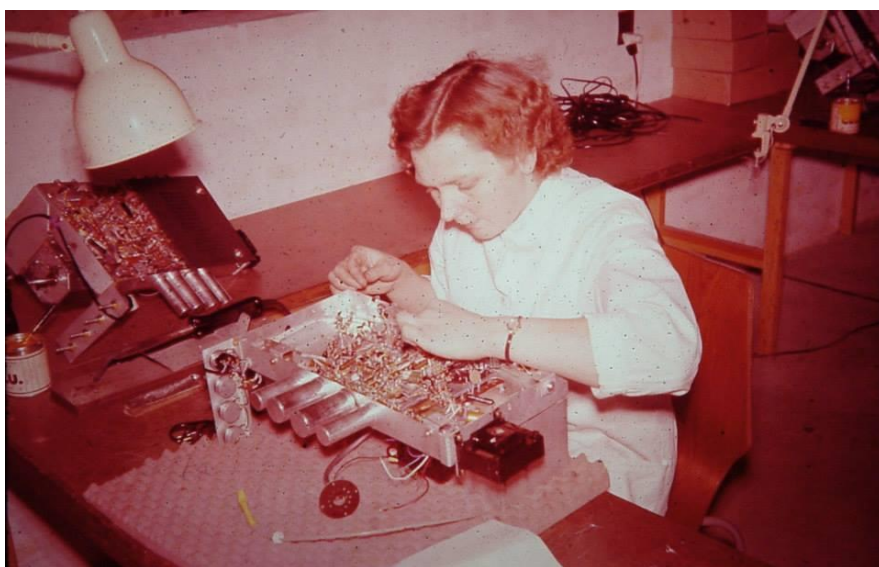
Efter en kort, men grundig oplæring kom kvinder fra egnen i beskæftigelse på fjernsynsfabrikken som loddedamer.