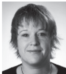
ledning i relation til opgave-, projekt- og forskningsforløb på universitetet.