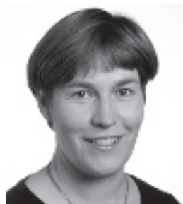
på Aarhus Universitet. Dette sker gennem forsknings- og udviklingsprojekter, kursustilbud og rådgivningsopgaver.