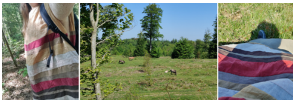
Figur 2. Istidslandskabskappen . 2024.

At blive et med istidslandskabet i en forunderlig spirituel trance, hvor kappen var medkonstituerende i at se landskabet, ikke som det er, men som det så ud, dengang sidste istid trak sig tilbage, og mammutter græssede på stepperne.