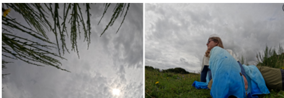
Figur 4. Himmelkappen . 2024.

At blive en bølge er endnu et eksempel på, hvordan beklædningsgenstanden giver anledning til at genopdage miljøet og, gennem en stærkt emotionel, nærmest spirituel, oplevelse i vand, skaber indsigter i naturforbundethed i relation til uddannelse. Billeder er taget med selvudløser, og der er også optaget videoer fra oplevelsen.