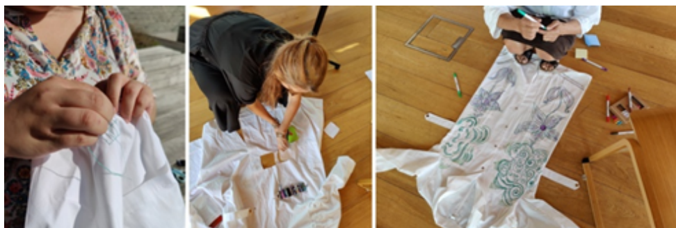
Figur 1. Kitlen . Fra venstre: Forskerpersona "Excella" broderer et Excel-ark på kitlen, "Wicked Scientists" vejleder agerer dekonstruktiv medskaber og klipper kitlen i stykker, mens "Geologen" dekorerer kitlen med levende landskaber. 2023.

Med kitlen som central beklædningsgenstand udvikledes forskerpersonaer som partielle selver, 'cyborgs' (Haraway, 1991) og 'co-agenter' (Michael, 2000) på et ph.d.-seminar med titlen SKY. Kitlen var udvalgt som beklædningsgenstand, fordi den er neutral (hvid) og kan fungere som et kreativt lærred, men også fordi den på forskellige måder relaterer sig til Det Naturvidenskabelige Fakultet, hvor de deltagende uddannelsesforskere institutionelt hører hjemme. "Excella" broderer et Excel-ark på kitlen, "Wicked Scientists" vejleder agerer medskaber og klipper kitlen i stykker mens "Geologen" dekorerer kitlen med stoftuscher. Nogle personaer optrådte kun på seminaret, mens andre jævnligt fremhandles, herunder "Wicked Scientist", en form for monstrøs persona, der fremtræder med en ituklippet kittel med 'wicked' genstande påhæftet og med grønt hår flettet med plastik eller andet affald.