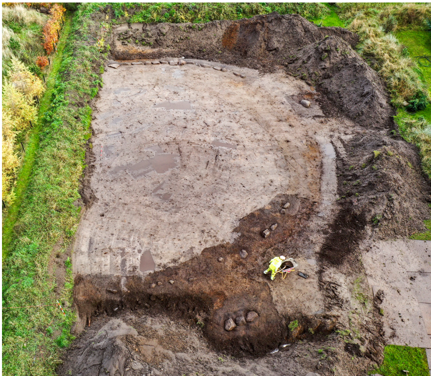
Dronefoto af gravhøjen under udgravningen i 2022. Her ses de bevarede randsten tydeligt omkring den indre kerne.

Tykkelsen af den bevarede del i gravhøjen var op til 40 cm, selv om gravhøjen oprindeligt nok har været flere meter høj. Omkring denne indre kerne blev placeret en rundkreds af sten, kaldet randsten. Stenene var ca. 50 cm i diameter. Da man i datiden havde lagt disse randsten, var gravhøjen ca. 18-19 meter i diameter, hvilket er ganske almindeligt for en gravhøj i Danmark.