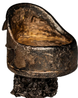
Stoleformet amulet – det såkaldte hjald udformet som et hængesmykke. Diameteren er 1,3 cm.

Arkæologerne fandt også smykker i graven, som er mere eksotiske end kostbare. Flere af smykkerne er unikke i en dansk kontekst og har nærmeste paralleller i Østersøområdet eller i Rusland. I fodenden i graven lå der blandt andet to tåringer af sølv.