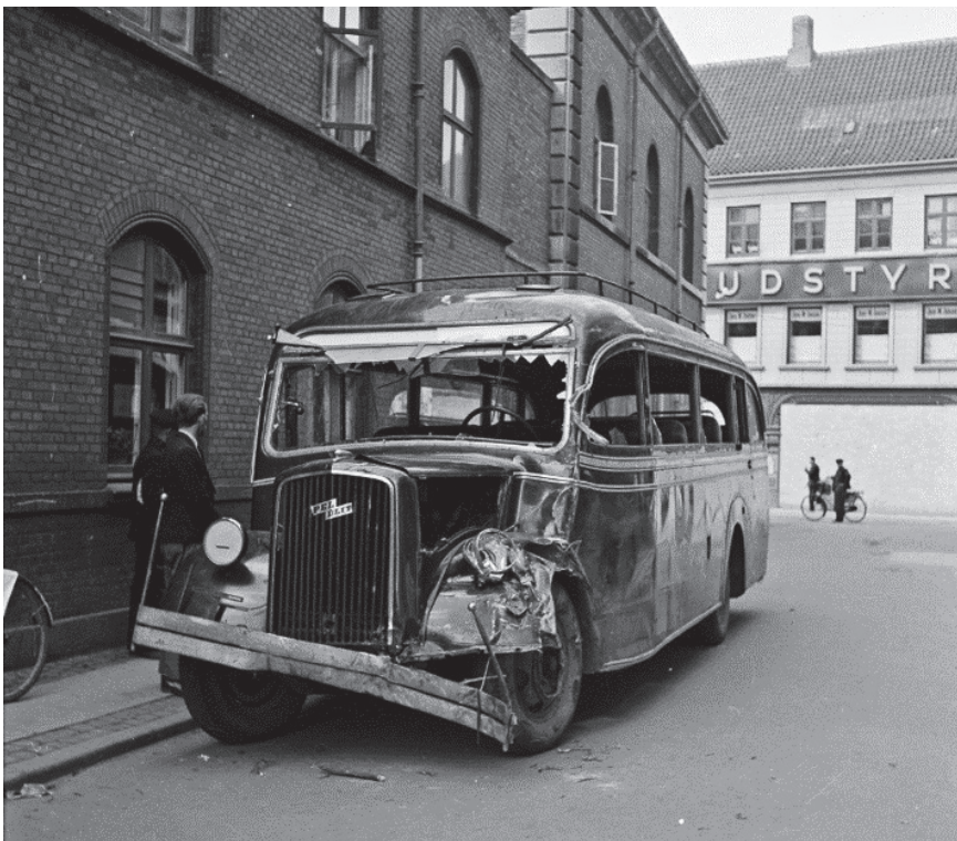
Bussen som Gestapo flygtede i.