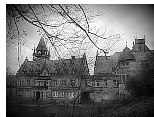
Slottet i Gondelsheim, som var ejet familien Douglas.