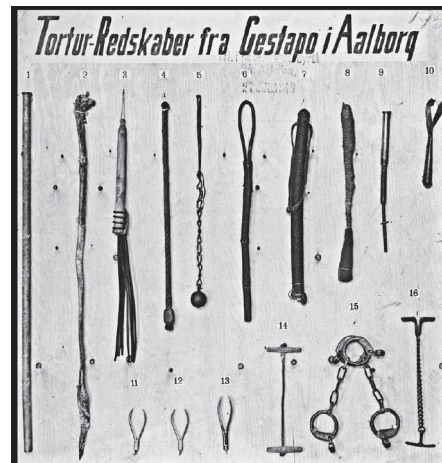
Politifoto af nogle af torturredskaberne, som Gestapo i Aalborg benyttede til at mishandle fangerne.