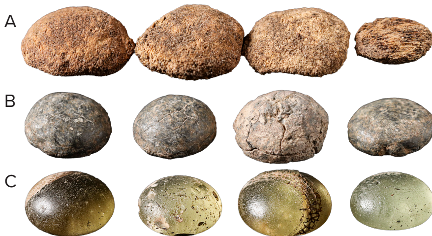
Spillebrikker fra Grønhøjgårdgravpladsen.

Blandt de mange ting, som har begejstret arkæologerne undervejs i gennemgangen af det store fundmateriale, er en serie spillebrikker,