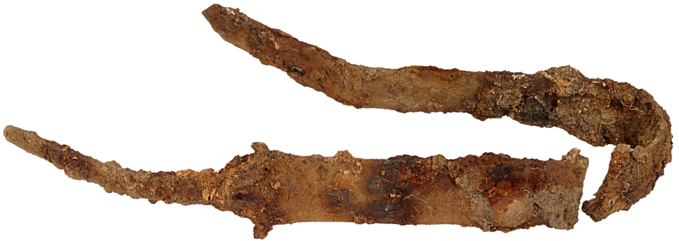
La Tène-sværdet med halvmåneformede stempler, som er placeret øverst på klingens greb.

er ca. 60 cm langt, men er bøjet på midten. Trods varmen fra ligbålet er sværdet overraskende velbevaret, så de to stempler, som sidder lige under sværdgrebet, er forholdsvis tydelige. De forestiller to halvmåner, hvor den ene vender op mod grebet og den anden ud mod den ene sværdæg (Se forsidebillede). Foruden sværdet indeholdt denne grav også en lansespids i jern, en jernkniv og en jernnål.