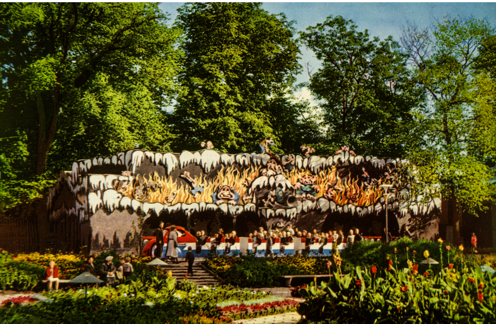
Spøgelsestog. Foran holder børnetog Lynsneglen. Postkort fra ca. 1950.