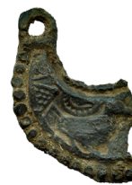
Ørering af tin/bly fra ca. 1050-1100. Fund fra Nytorv.

Fra arkæologiske undersøgelser andre steder i Aalborg, vides det at byen i den senere del af middelalderen i 1300-1400-tallet var omgivet af en befæstning med vold og voldgrav. Fra skriftlige kilder ved vi desuden, at den også har haft "planker", der må forstås som en form for palisade. En sådan bybefæstning er en kompliceret sag, der naturligvis kun kan undersøges i små bidder i løbet af mange års arkæologi. Store dele af dens forløb er dog kendt, ligesom der også vides meget om dens konstruktion og form. Fra befæstningens forløb ved Bispensgade er der tidligere udgravet to pæle, som stammer fra træer, der er fældet i vinterhalvåret 1292-93 og 1317-18 e.Kr. Disse dateringer, der er opnået ved årringsdateringer, er fortsat de mest præcise, der kan knyttes til bybefæstningen.