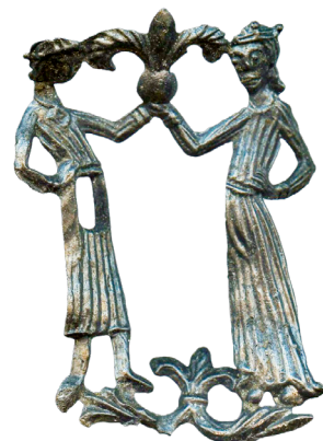
Spænde af tin/bly fra omkring 1300. (Forsidefoto). Fundet på den gamle strandoverflade under Nytorv.