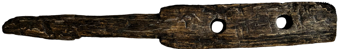
Holder til et padleblad fra et vandmøllehjul. Den er lavet af egetræ og blev fundet i voldgraven lige over plankespærringen.