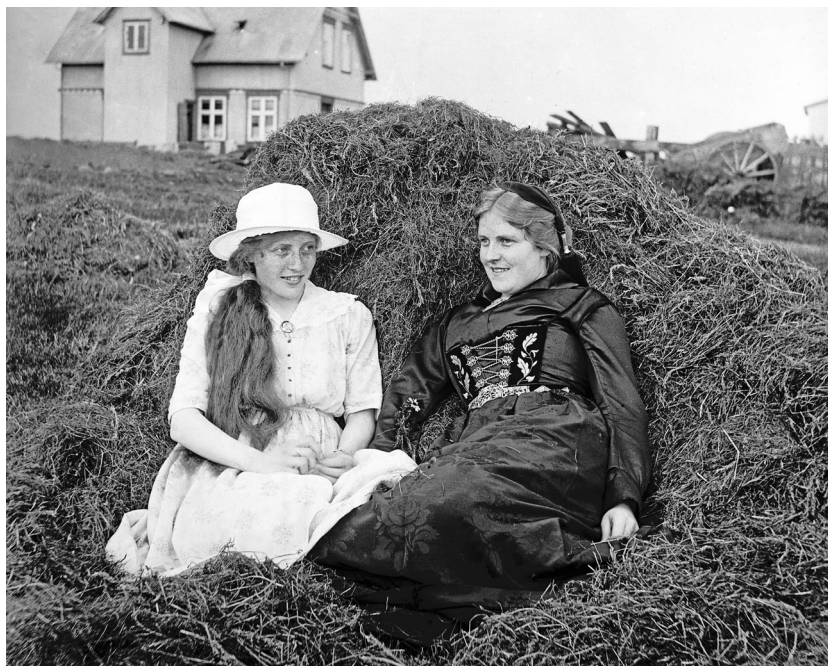
Dansk mode og islandsk tradition. Foto fra omkring 1920.

Jeg tør ikke svare, at denne, den smukkeste af alle de mange Nationaldragter, jeg har seet, i Danmark kun vilde kunne bruges paa en Maskerade, og at det altsaa vilde være lidt vel flot at anvende 2 á 300 Rd. paa dens Anskaffelse (Arnesen-Kall 1869: 204).