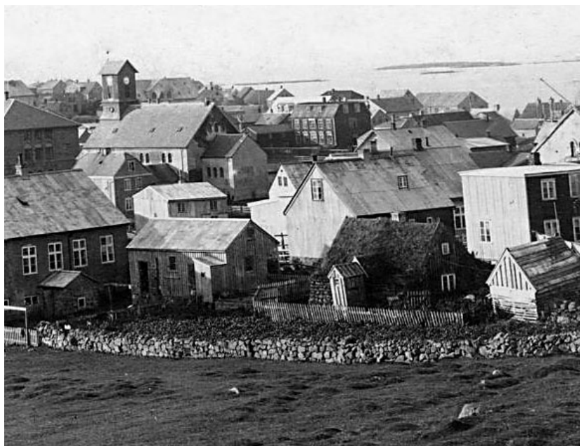
Reykjavik voksede støt i det 19. århundrede, og blev hurtigt landets førende by. Foto fra omkr. 1900.

I det følgende sættes der fokus på mødet mellem dansk og islandsk kultur og de forhold, der især bidrog til at fremme dansk kultur. Endvidere drøftes disse forholds betydning for det danske sprogs status og funktion i Island. Hovedvægten lægges på perioden fra den sidste del af det attende århundrede og indtil begyndelsen af det tyvende århundrede, da islændingene opnåede en markant selvstændighed. Artiklen baseres dels på forskellig faglitteratur, dels på tekster fra aviser og tidsskrifter, samt personlige kilder i form af breve, erindringer og rejseskildringer.