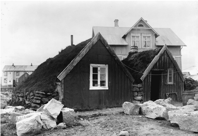
Moderne bebyggelse og et fattigmandstørvehus i Reykjavík omkr. 1900.

Ændrede byggeskikke krævede nye materialer og værktøj, og til »danske« huse hørte andre typer af møbler, inventar og brugsgenstande. I stedet for ét fælles rum, badstuen med sine ganske små vinduer, kom der flere værelser, som alle havde særlige funktioner og tilhørende møblement og tilbehør: spisebord, stole og skænk i spisestuen, opholdsstuen havde sofa, lænestol m.m., soveværelset seng og toiletmøbel. I køkkenet, som i det nittende århundrede var under stadig udvikling, opstod nye be-