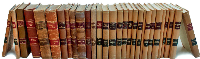
Figur 1: De 26 bind (enkelte i flere delbind) af Danmarks Stednavne som er udkommet i perioden 1922-2013.

deres lydlige udviklinger og dannelsesmåde op igennem tiden er således en væsentlig kilde til mange fag som sprogforskning, geografi, historie, arkæologi m.fl. Derfor er det en vigtig opgave at tilvejebringe viden om stednavnene i en form som kan benyttes bredt. Denne viden kan findes i Danmarks Stednavne (herefter DS).