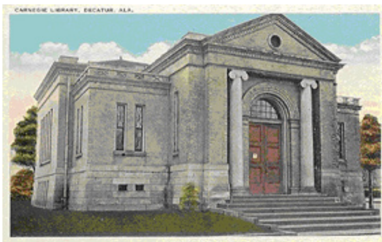
Carnegiebiblioteket i Decatur, Alabama fra 1903.

Carnegie bibliotekerne var udbredt over hele den engelsksprogede verden, men også i Skandinavien fik modellen betydning, dog i forenklet udgave. I skandinavisk sammenhæng spillede den sammen med tyvernes nyklassicisme, som prægede periodens byggeri i form af f.eks. skoler, museer og biblioteker i retning af symmetri, enkelhed og orden. I løbet af trediverne påvirkedes eller afløstes den af modernismen. Stadsbiblioteket i Stockholm fra 1928 kan nævnes som eksempel på denne udvikling. Et godt eksempel på inspirationen fra Carnegie bibliotekerne er nybygningen af det daværende Hjørring Centralbibliotek fra 1927.