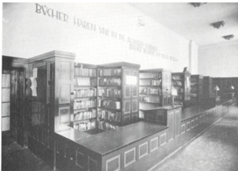
Kat. Nr. 20/2/2/8: Sandleitenhof, Bibliothek Efter Seliger, 1985, 651

Bibliotek i Sandleitenhof med skranke og lukkede hylder: „Bücher haben uns in die Sklaverei gebracht. Bücher werden uns wieder befreien.“