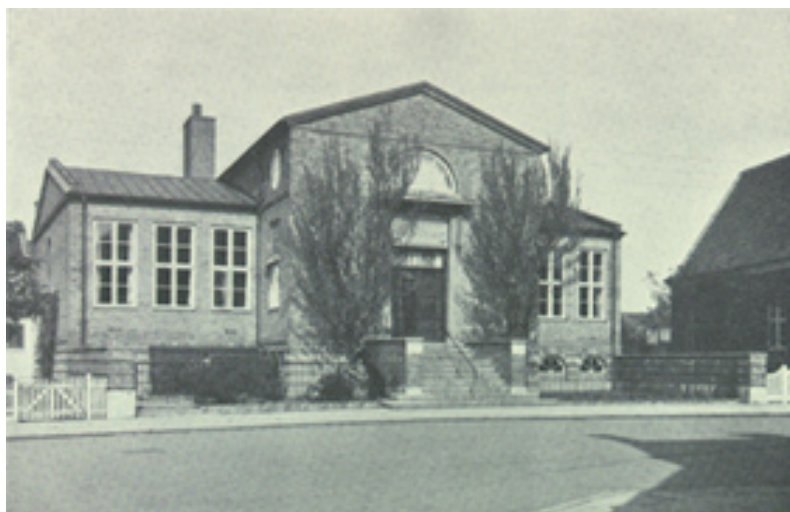
Hjørring Bibliotek fra 1927 med tilpasning til en mere enkel dansk nyklassicisme. Samme høje trappe, men uden søjler. Efter Jørgensen, 1946, 75