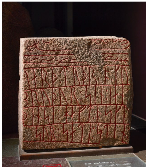
Figur 3 Sønder Kirkeby-stenen, hvor vieformlen ses under skibsikonet - separat fra hovedskrift og ikon.