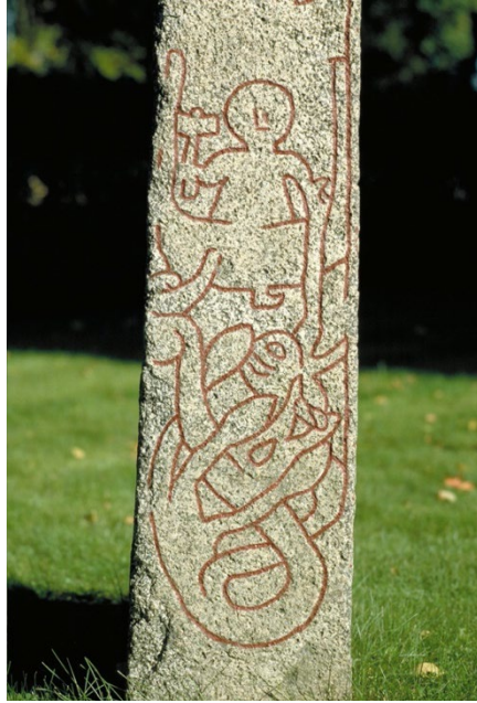
Figur 4 Altunastenen fra Uppland Sverige. Rune database: https://app.raa.se/open/runor/inscription?id=e4d517-7524-43e2-97dd-2fee2a4da84d