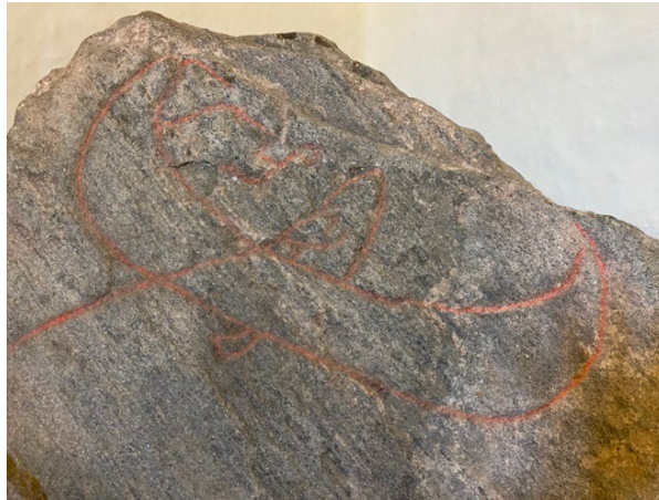
Figur 2 Hørdumsstenen: Thors fod igennem bunden af båden med fiskeline. Dog er Midgårdsormen ikke bevaret særligt.

Thor-motiverne er bemærkelsesværdigt konsekvente på tværs af kilder: han er tæt forbundet med vand, rejse og kampen mod kaos. Uanset om han fremstilles som katastrofens ophav eller dens beskytter, er han den figur, der kontrollerer naturens kræfter. Dette gennemgående mønster i både ikonografi og litteratur tyder på, at Thor havde en central rolle i den middelalderlige forståelse af naturens farer og katastrofer.