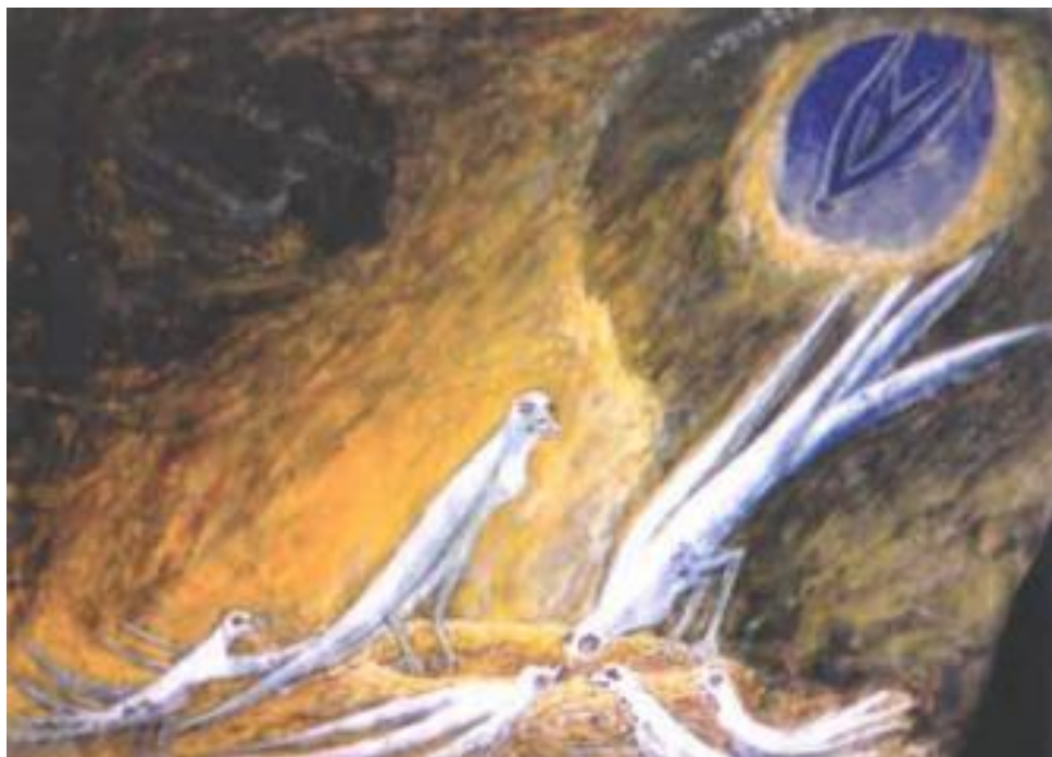
Figur 4. Ovartaci har her malet et af sine mange tidligere liv, denne gang som svale.

Man tænker jo, at der findes en sjæl, som kan gå helt nær solen, og denne kunstneriske tanke, den kan aldrig blive helt opfyldt, selv når vi dør [...] Og det er altså denne kunstighed med solen, denne ukendelighed med solen, som – altså den værende dirigent, der er under solen, han er selv angst for solen, og dog tror han, at forfædrene er solen, og denne ukendelighed at komme endnu højere op, end hvor han er, altså i det højeste stadi, hvor Gud bor – den nuværende, som man kalder Gud fra jorden af, han er udnævnt til at være Gud – han har et stadi endnu højere oppe og bor inde i solen, som han tror engang at kunne nå – til den inderste sol – og tror, at den er et levende væsen, altså at livet er et levende væsen. (Nielsen 2006: 141)