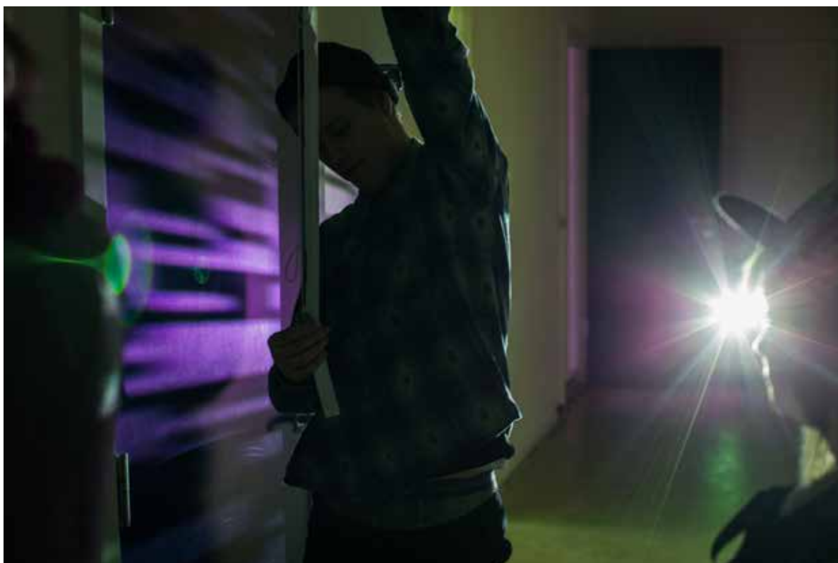
En matematiktime på Sisters Academy #01.