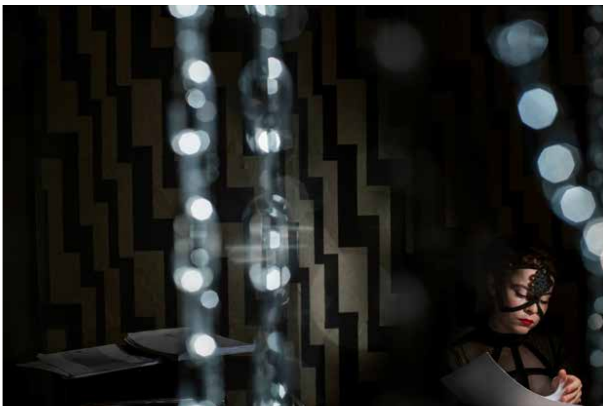
The Link in her office.