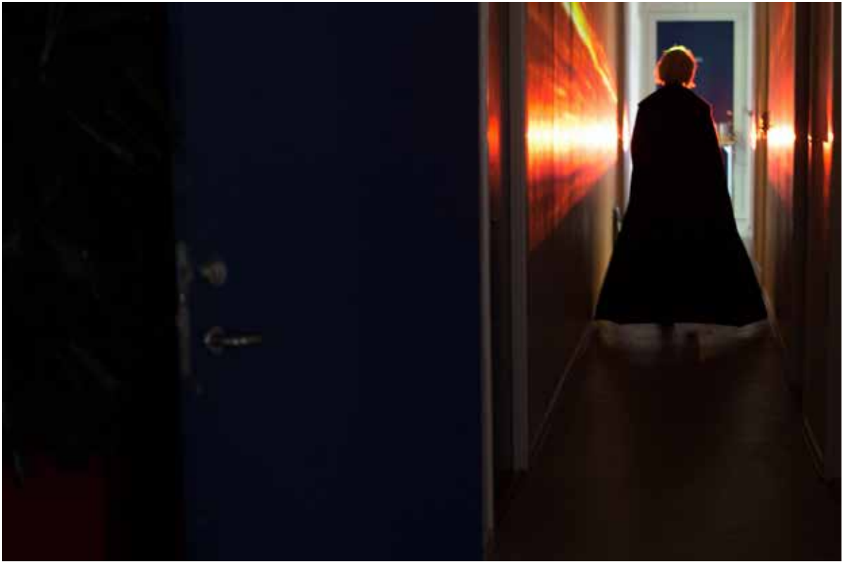
En lærer bevæger sig ned ad en gang på Sisters Academy #01.