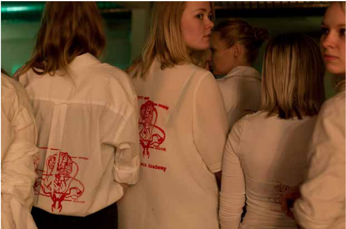
Elever ved åbningsceremonien på Sisters Academy #01.

En visuel rejse gennem den første manifestation Sisters Academy #01 :