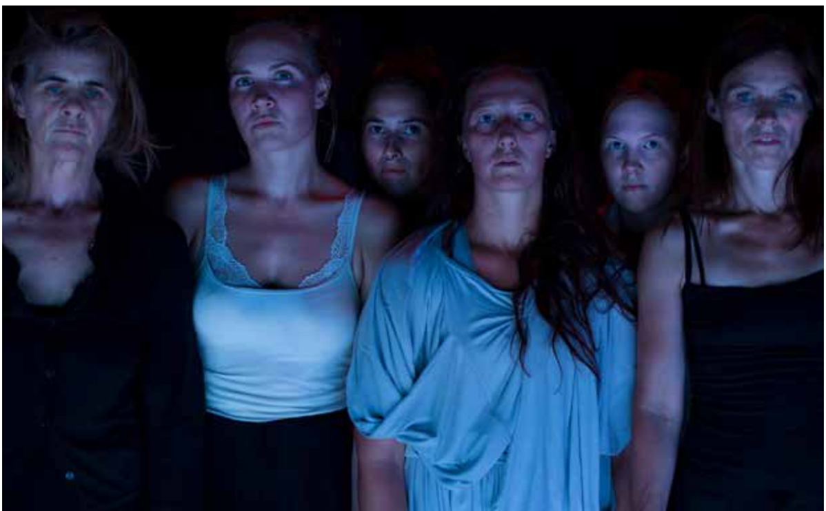
In the class of The Untamed.