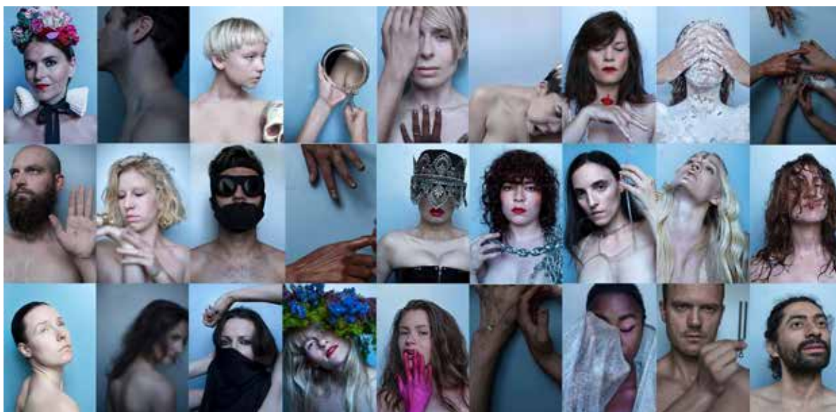
Sisters staff. Poetiske portrætter forud for Sisters Academy #3, Sverige – The Boarding School manifesteredes på Inkonst.

At påtage mig et »poetisk selv« forekommer ofte frigørende. Uden at blinke med øjnene kan The Sister , The Ambassadors Wife eller The Fiction Pimp fremsige store og radikale visioner. Det hører det poetiskes væsen til. Jeg vil nu give ordet til mit poetiske selv – The Sister . Fra denne udsigelsesposition vil jeg dele Sensuous Society-manifestet, som også er baggrunden for kunst- og læringsprojektet Sisters Academy , som denne artikel omhandler. I Sisters Academy oversætter vi kritikken til en praksis, hvor vi afprøver alternative tilgange til væren, samvær og læring gennem den fysiske deltagelse i en radikalt anderledes verden.