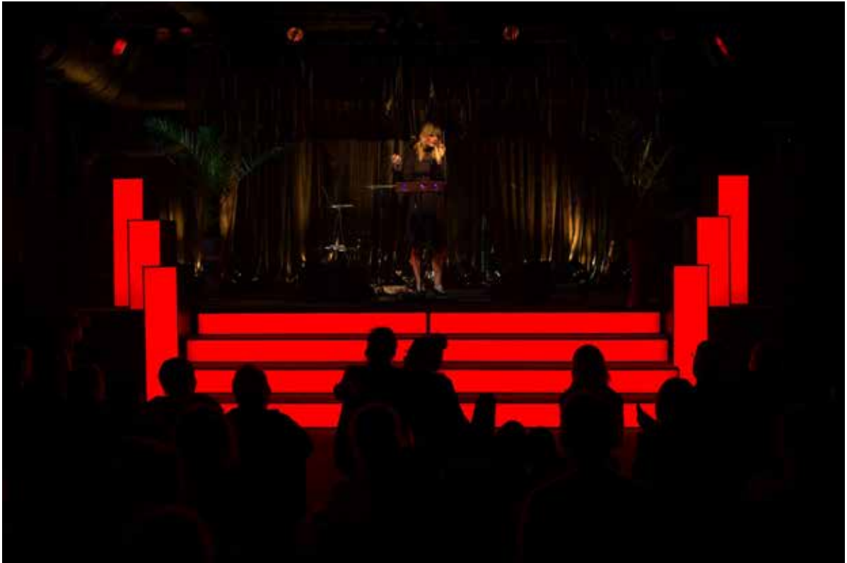
The Concert Hall.

arme og 9 ben. Helt konkret 3 kvinder der er bundet sammen. Formålet er, at få forskellige perspektiver på vurderingen af, hvilken undervisning du er parat til at foretage og deltage i hvornår.