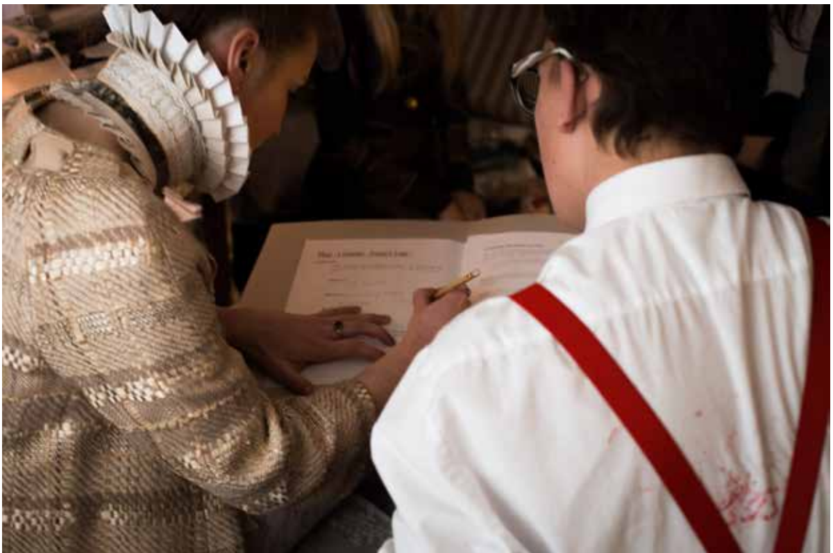
The Protector of the Archive og en elev på Sisters Academy #01.