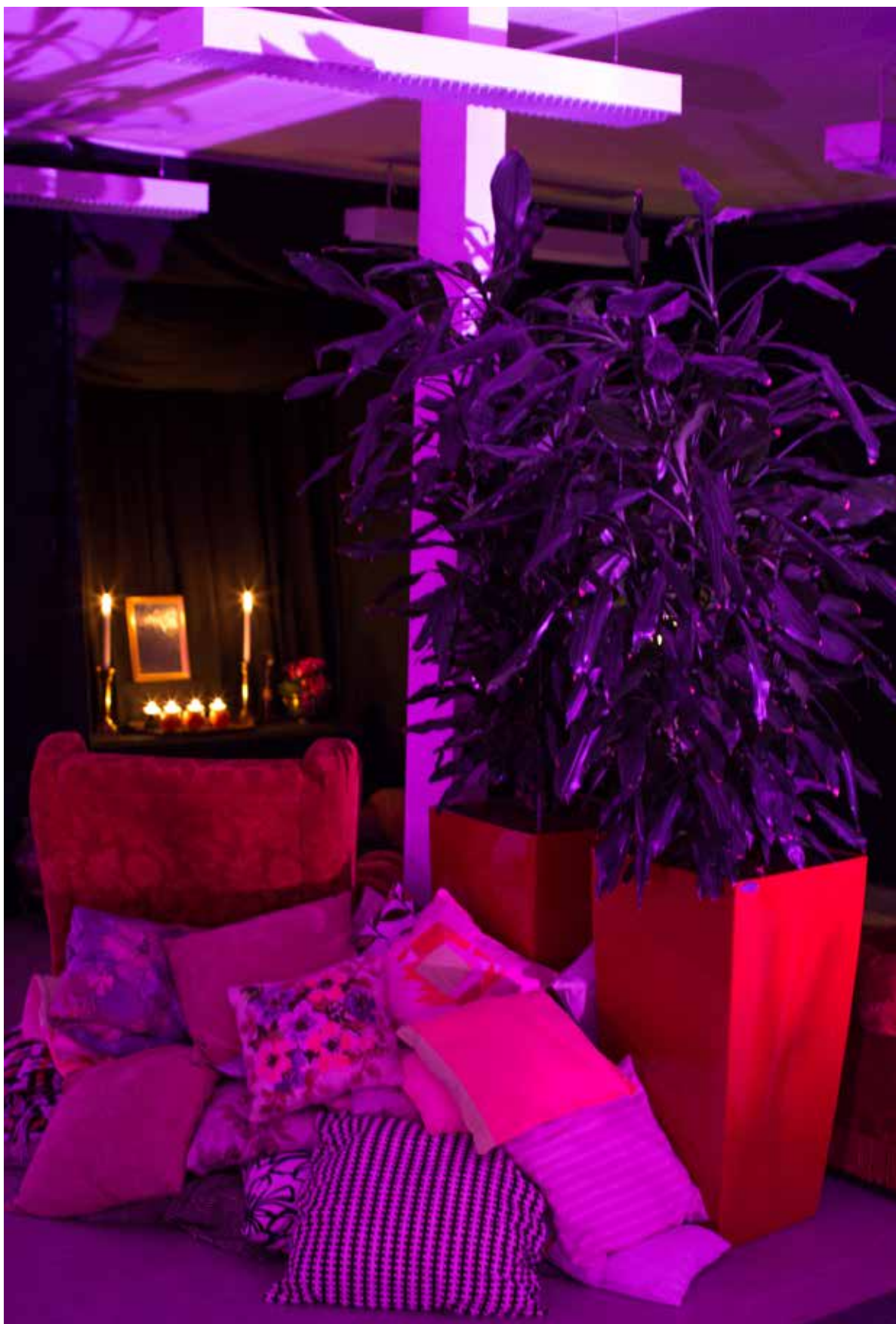
Et Klasseværelse på Sisters Academy #01.