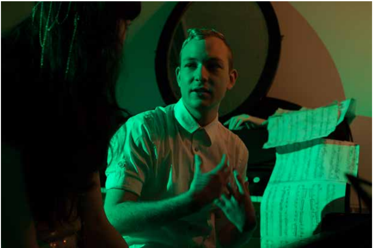
En elev i samtale med The Chain Hands Pianist.