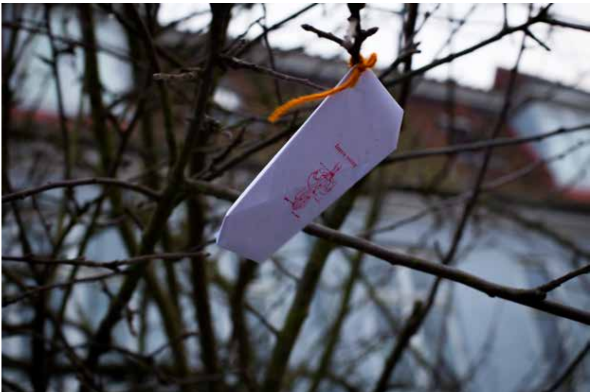
Breve fra besøgene på Åbent hus-dagen d. 28.2. Her blev de efter besøget bedt om at skrive deres håb, drømme og konkrete forslag til fremtidens uddannelsessystem ned. Brevene blev hængt på et træ i skolegården. Efterfølgende blev brevene indsamlet og indgår i de data, der i øjeblikket bearbejdes fra Sisters Academy #01.