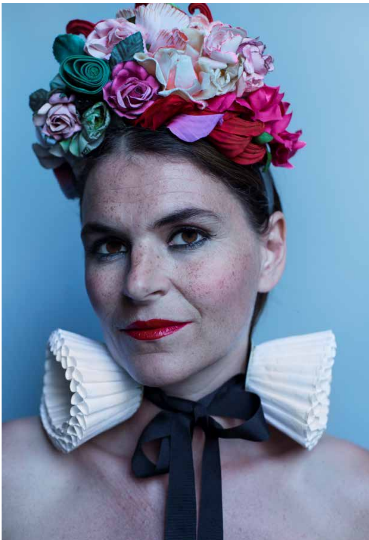
The Sister.