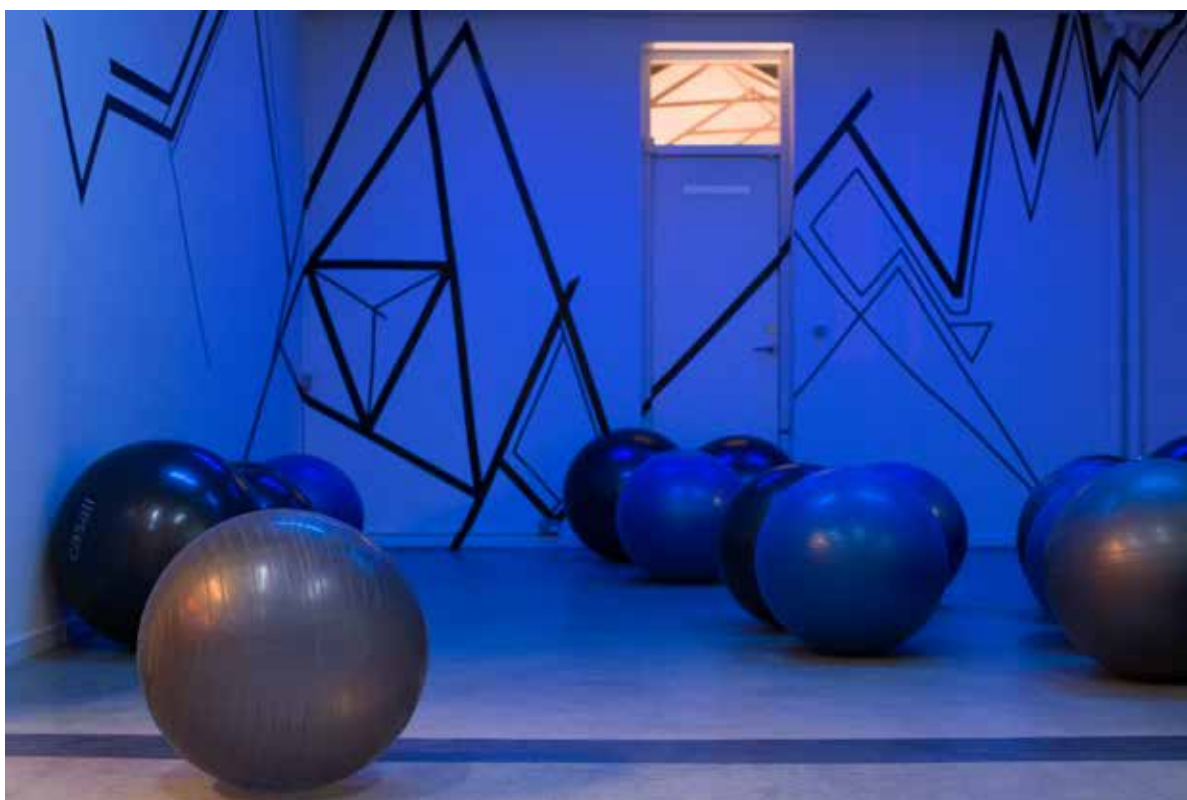
Et klasselokale på Sisters Academy #1.