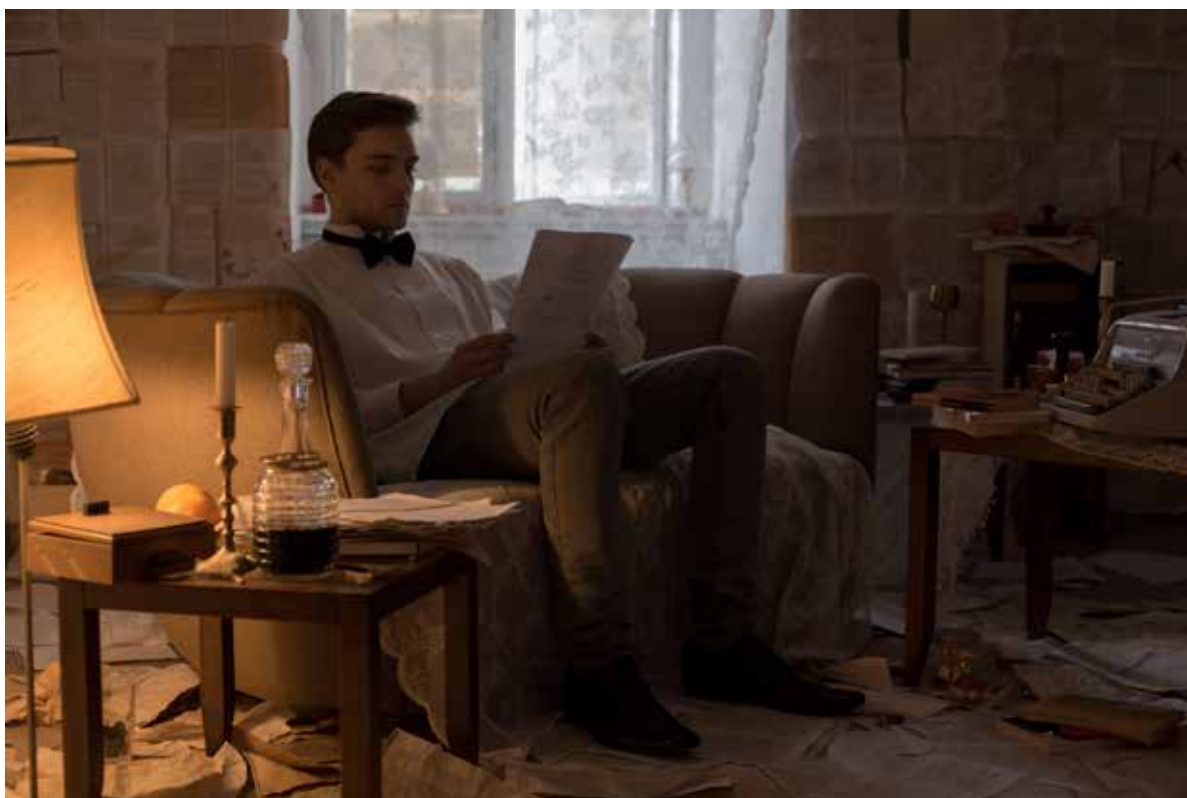
En elev laver lektier i Protector of the Archives' tableau på Sisters Academy #01.