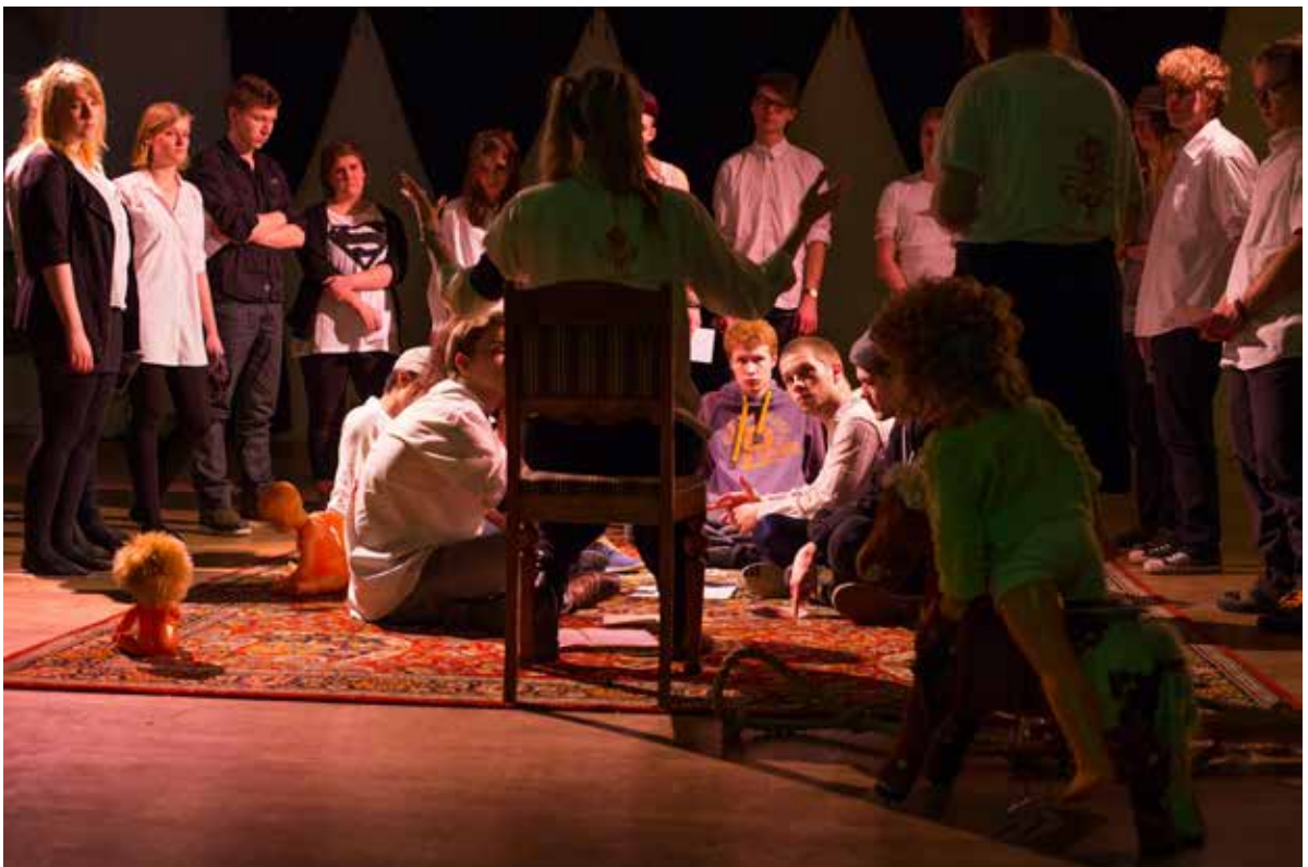
Der var også undervisning i The Grand Hall.