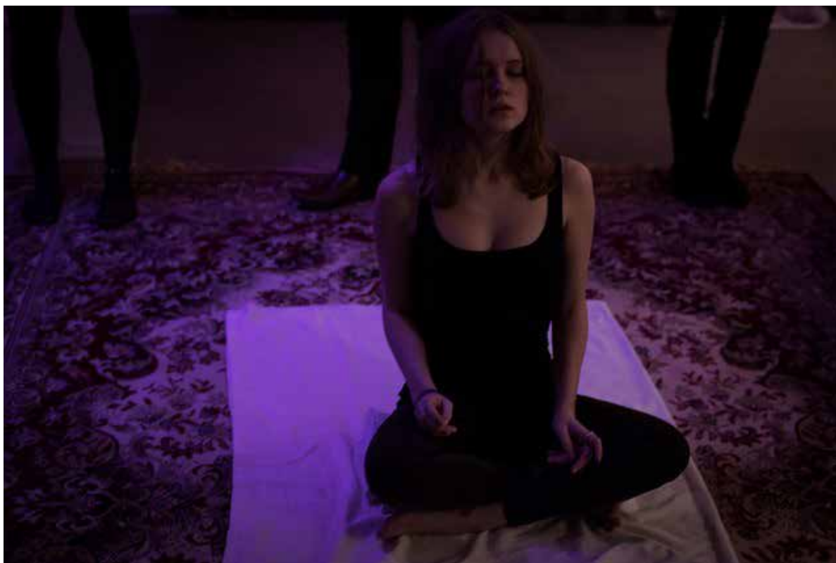
En elev i en religionstime på Sisters Academy #01.