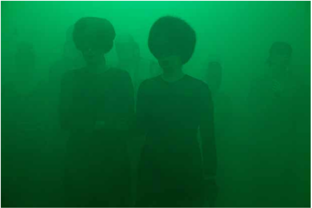
Søstrene i The Grand Hall, hvor de nye head mistresses' kontor lå i Sisters Academy #01.