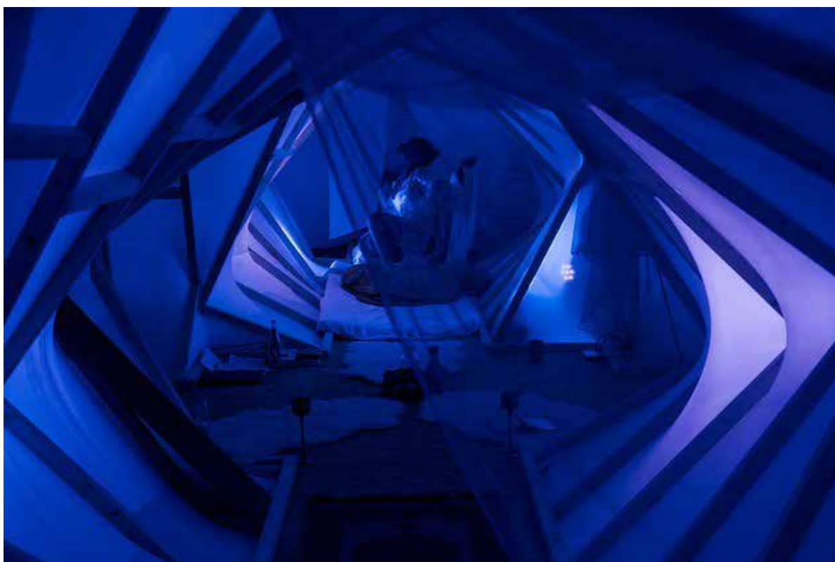
The Nurse's Tableau på The Boarding School.