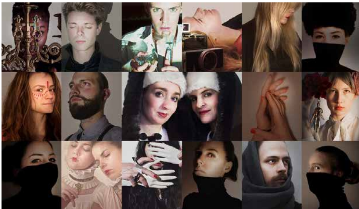
Sisters staffs' poetiske portrætter forud for Sisters Academy # 1, Denmark – The Takeover, som manifesteredes på HF og VUC FYN, FLOW.

Denne blog-post bevidner også det samarbejde, der opstod med »performance staff« (ofte blot omtalt som 'staff') under manifestationen. Som led i den omfattende scenografiske transformation af skolen flytter der en række nye kollegaer ind på skolen – »The new staff« eller »performance staff«, som de kaldes. Performerne etablerer sig rundt omkring på mulige og umulige steder på skolen, i det vi kalder »tableauer«. Her bygges et scenografisk miniunivers med udgangspunkt i performerens rolle. Dette tableau repræsenterer deres poetiske selv, og de er derfor meget forskellige i deres udtryk.