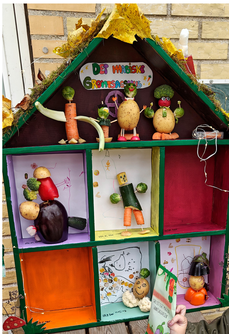
Leg med grøntsagsmonstre i hus. Grøntsagsmonstrene lavede nogle børn sammen med et par studerende.