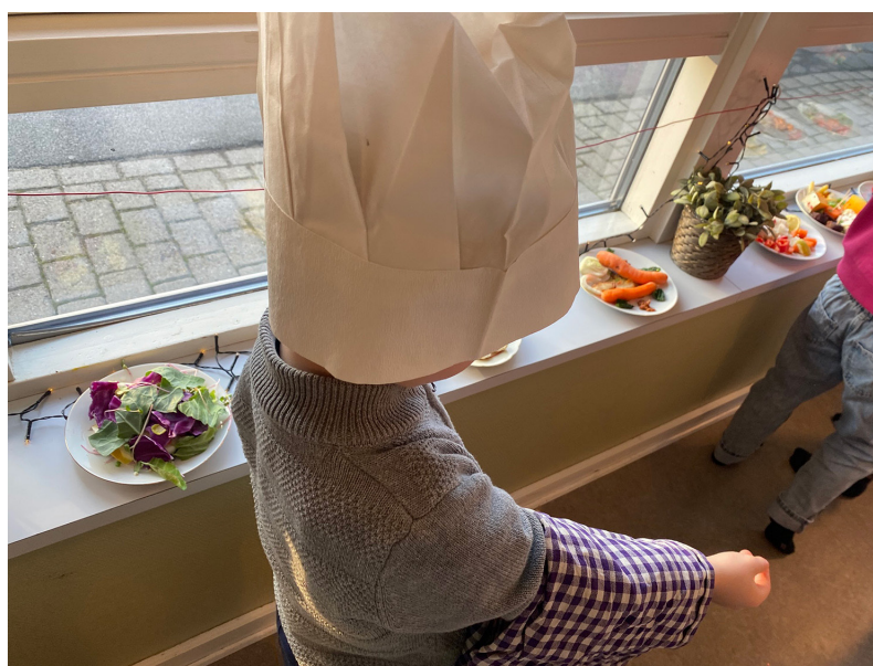
På billedet ses, at en dreng forbereder sig på at servere, en tallerken med grøntsager, som han har anrettet.

Alle voksne og børn er i gang med at skrælle og skære, tage kerner ud af granatæbler, de smager og spiser, vender sig mod hinanden, taler, smiler og viser interesse. Rummet er fuld af forskellige dufte, bjerge af grøntsagsskræller, stille lyde og fordybelse. Børnene får en porcelænstallerken hver, som de begynder at anrette grøntsager på. En pige hopper af begejstring, da alle tallerkenerne er anrettet. Børnene serverer hver især deres tallerken for forsker L. Byskov og to pædagoger. Børnene har et viskestykke over armen imens, at de serverer. (Observationer foretaget af forsker M. Steentoft)