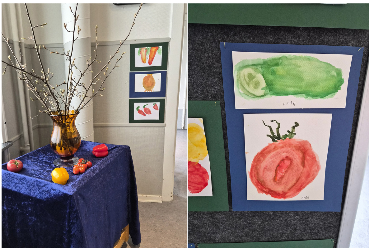
(Illustration: malede grøntsagsbilleder med bord foran) (Illustration: malede grøntsagsbilleder på væg) Billederne viser nogle eksempler på malerier, som børnehavebørn i X-købing har lavet. Grøntsagsmalerierne blev vist på en fernisering den 20.3.2026.