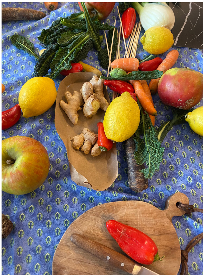
Grøntsager, spækbræt og urtekniv på bord. Billedet viser et udsnit af de grøntsager, som børnene arbejdede med i grøntsagsrestauranten.