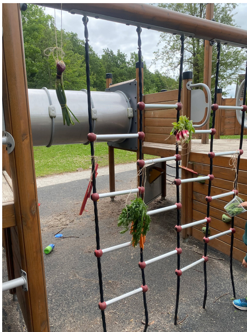
På klatrestativet hænger grøntsager, som forskere i samarbejde med børnene har hængt op.

Uddrag fra feltnoter til aktivitet: Jeg, forsker N. Hawes, er klatret op i klatrestativet med et stort bundt bladselleri og leder efter gode steder at hænge dem. Et barn kommer klatrende hen til mig, kigger på bundtet i min hånd og herefter udspiller følgende sig: