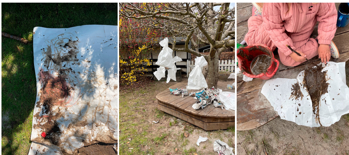
Billede 2-4: Undersøgelse af materialitet