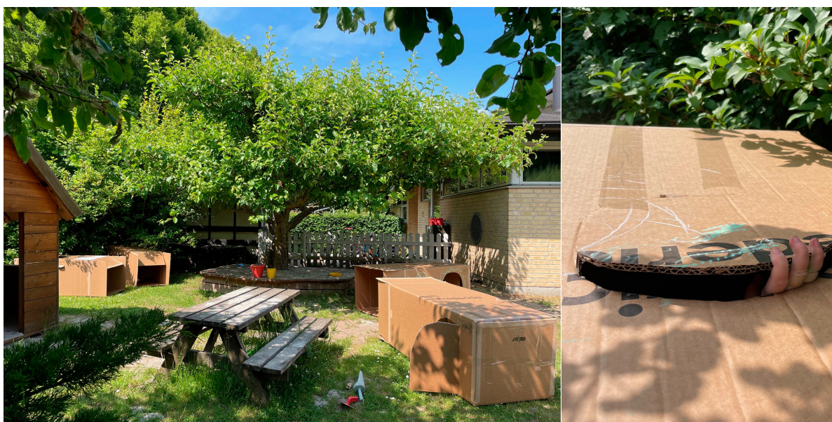
Billede 5-6. Overraskende papkassesamling på legepladsen