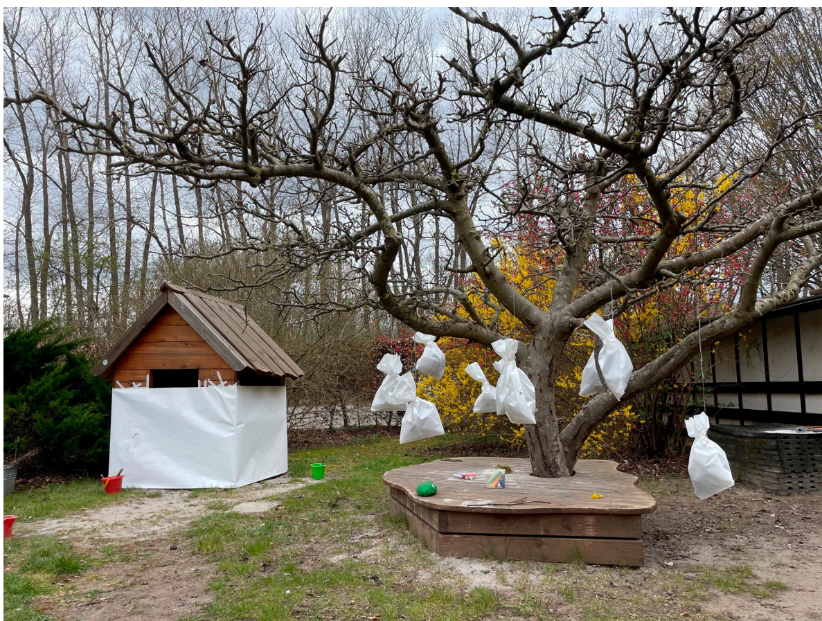
Billede 1: Afprøvning med rum og materialitet på legepladsen

Kreativitet hænger uløseligt sammen med frirummet til at eksperimentere og afprøve egne ideer, hvilket ofte er baseret på en induktiv didaktik. Det er pædagogens rolle, at stilladsere forløbet, inspirere, invitere til at lære noget eller understøtte de børneinitierede aktiviteter – det vil sige opmærksomt følge børnenes spor og interesser (Cecchin, 2015, Boysen, 2020). Det kræver legemodige voksne, der tager leg alvorligt, kan udfordre sig selv og barnet og støtte skøre påfund, hvor man ikke er sikker på at eksperimentet lykkes.