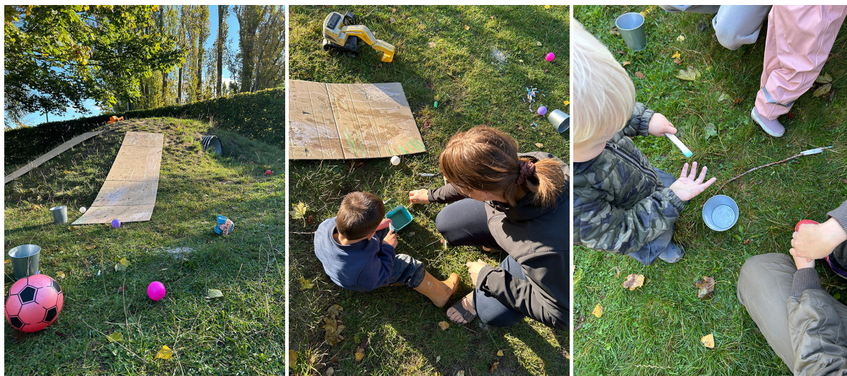
Billede 10: Store ark af pap skaber plads til, at flere børn kan deltage

Afprøv mangfoldige materialer og ikke kun tydeligt skriptede materialer, men bland evt. utraditionelle hverdagsobjekter eller legetøj med svagt skriptede materialer og stedlige materialer. Det vil få børn og voksnes fantasi i gang. Det er samtidig pædagogernes ansvar ikke at bruge mere, end der er basis for og inddrage genbrugsmaterialer, hvor det kasserede forvandles og anvendes på ny (Holm, 2011). Herigennem kan børnene potentielt lære at være kritiske omkring forbrug og at passe på naturen.