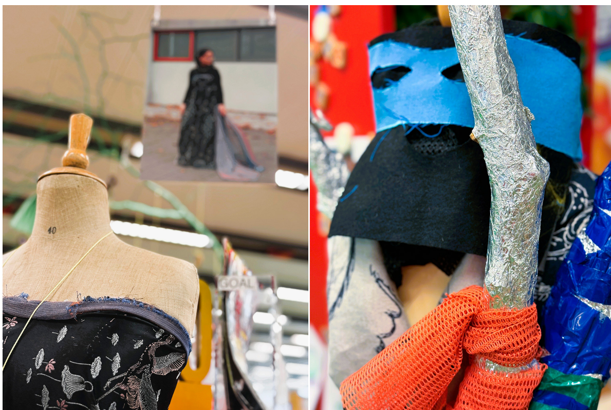
Kostumeworkshop, Ninjakappe, maske og sværd (Fotos: Institut for Børnekultur).

Midt i det hele stod en stille dreng, som havde udset sig et stort, tungt stykke stof til sin ninjakappe. Han stod lidt opgivende med stoffet, som om han ikke kunne gennemskue, hvordan han skulle komme videre med det. Jeg spurgte, om han ikke kunne tænke sig mindre stykke stof og fandt forskellige stykker i bunken, som ville være lettere for ham at håndtere. Men han blev ved med at tage fat i det store stykke. Det var som om, han allerede havde set kappen for sig. Jeg hjalp ham med at klippe huller til arme, vikle det rundt om ham og binde det fast med et bånd. Det blev en fantastisk ninjakappe – lidt tung og upraktisk, men han strålede af stolthed og gik straks i gang med at lave et sværd ud af en pind, han havde fundet i pausen.