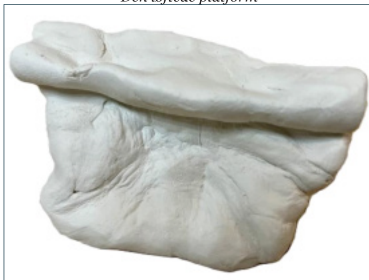
Den løftede platform

»En løftet platform, som skal symbolisere, at man i løbet af sin hverdag kommer over sit daglige, et pusterum, at kunne trække vejret. Dens perspektiv (figuren red.): Jeg er her, så du har mulighed for at sidde ned, så du kan få en pause i den travle hverdag, men jeg håber stadig, at jeg formår at løfte dig op fra vores pligter i livet«