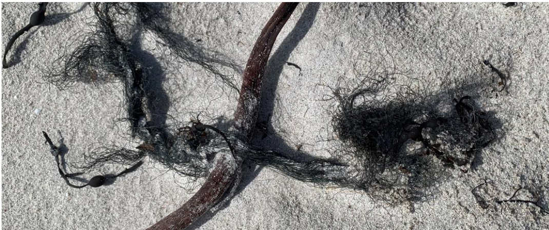
flettverk av tau og tare på en strand vest i Norge.