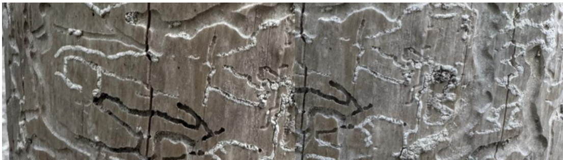
Eget foto: collage av barkebillespor