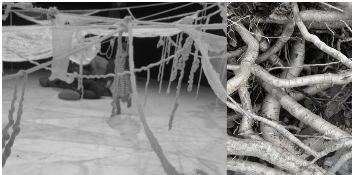
Collage satt sammen av foto fra forestillingen Økohelter og et foto av røtter fra en strand ved Oslofjorden