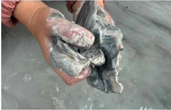
Leire møter vann og barnehagebarn