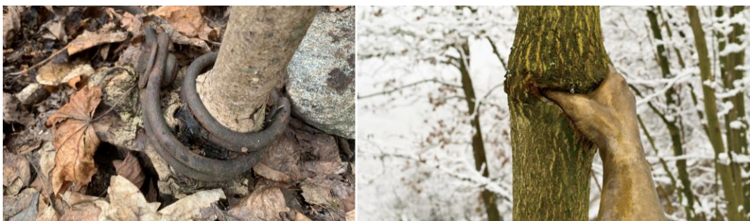
Giuseppe Penone, Alpi Marittime—Continuerò a crescere tranne che in quel punto (Maritime Alps—It Will Continue to Grow Except at That Point), 1968/2003, tree, bronze; arm, 15 3/4 x 4 x 5 1/8". Installation view, Maritime Alps, near San Raffaele Cimena, Italy, 2008. 1000 WORDS: GIUSEPPE PENONE ( artforum.com )