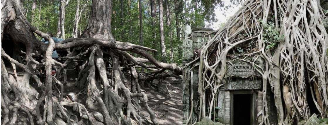
T.v. Eget foto av barn i lek mellom røtter nær en strand ved Oslofjorden. T.h: foto fra Tha Prohm temtelet.