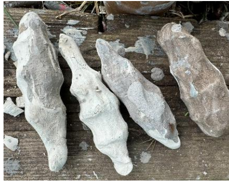
Urformer formet med forskerhendes kraft og bevegelse.