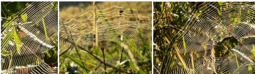
Eget foto: Edderkoppspinn, spindelvev – flettverk?