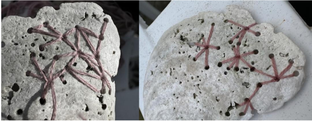
Eget foto fra broderiprosess i skjell med hull etter boresvamp.