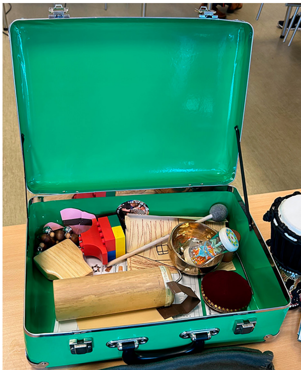
Kuffert med personligt twist på indhold

Deltagerne i eksemplet bliver kastet ud på dybt vand i denne spontane lydfortælling, men underviseren agerer sikkerhedsnet ved at tilbyde lydgivere ( regissør ), stille spørgsmål ( legeleder ) og deltage aktivt i legen ( legekammerat ). Derfor kan lydlegen hele tiden udvikle sig og give deltagelsesmuligheder for alle.