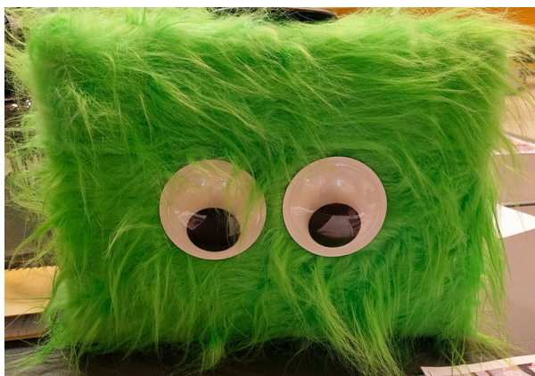
Kuffert med personligt twist på udseende

Den grønne kuffert og brobygning mellem dagpleje/vuggestue og børnehave