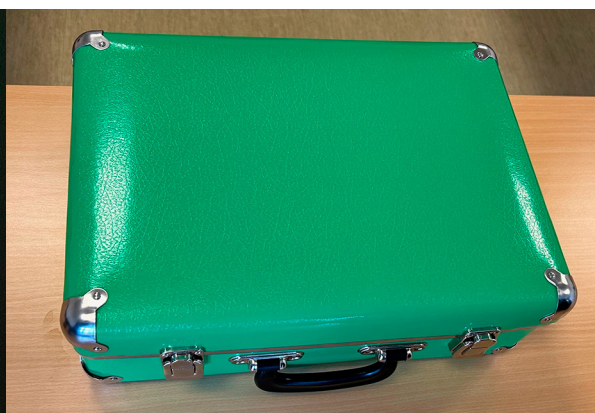
Den grønne kuffert.