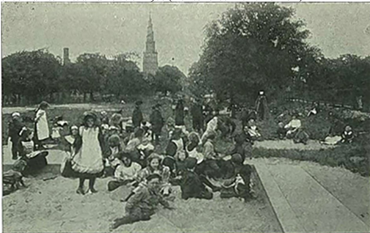
Fig. 34. Legeplads med Sandanlæg i Elefantens Båstion, Christianshavns Vold.