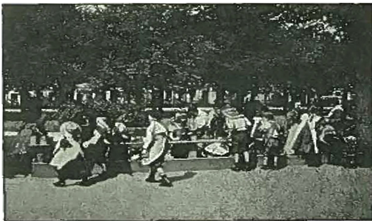
Fig. 19. Praktiske Legeborde, Hamburg.

En af Dragehjelm's inspirationskilder til hvad han forstår som et praktisk legebord, som en del af sandkassens træramme (ibid.: 50).