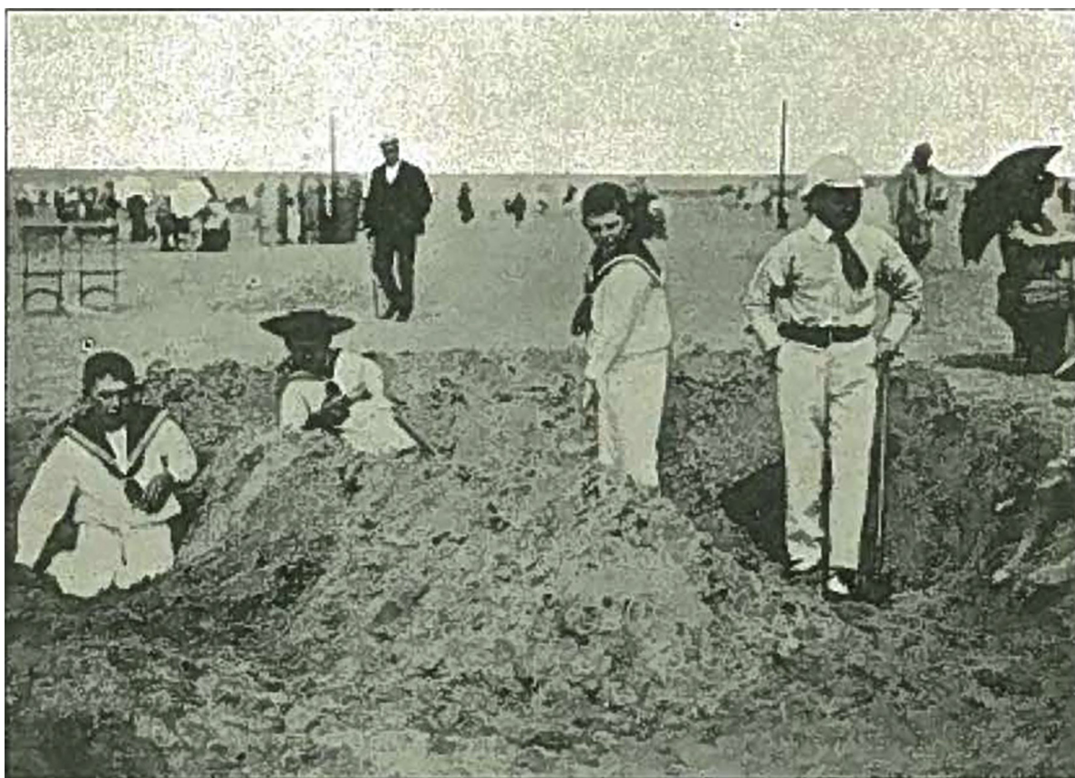
Fig. 21. Paa Strandbredden i Ostende, Belgien.

Større drenge har sammen gravet og formet en form for vold af sand. De er fint klædt på, hvad der tyder på, at det er børn af velhavende voksne, som er taget en tur til stranden på en feriedag eller en søndag. Billedet viser også børnenes arbejdsproces med sandet, der er ved at blive til et værk (ibid.: 56).