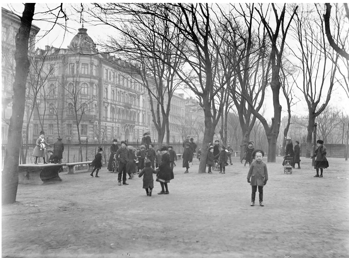
Ørstedparken 1891. En tom plads med grus, hvor børn kunne lege sammen.

Det første eksempel på en særlig plads tilegnet børns leg i storbyen ses i 1876-79, hvor den første legeplads bliver anlagt i Ørstedparken i København (Coninck-Smith 2011.: 182–183). Det var en stor tom plads med grus, som nedenstående fotografi viser. Der var ingen gynger, rutsjebaner, legeredskaber eller en sandkasse, som vi kender det på legepladser i dag. Til gengæld kunne børnene løbe rundt og lege med hinanden, hvilket ellers ikke var accepteret i byens gader (Coninck-Smith 1990: 54; Mørk 2006; Schmid, 2017: 428).