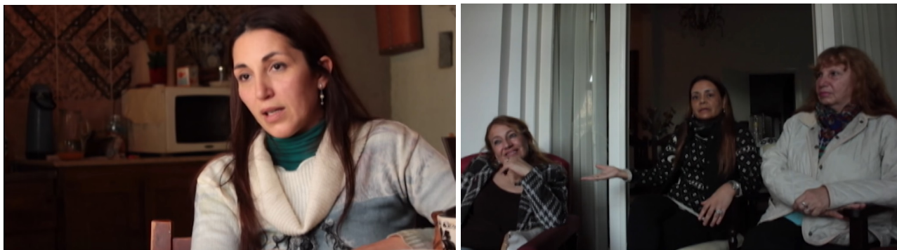
Figuras 1 e 2: imagem de entrevista em plano médio, com dona de pensão fronteira, e de plano aberto com três professoras da Escuela Verón, respectivamente.

As imagens de transição são bastante variadas. Muitas delas fazem referência aos conteúdos dos depoimentos. Nesse ponto, percebemos que as imagens são mais diversificadas quanto a enquadramentos e movimentos de câmera do que no restante do documentário. Outras cenas de transição parecem falar por si ou complementar ideias introduzidas pelas frases escritas, como uma composição que mostra a ponte que liga as duas cidades ao fundo. Também nessa linha uma imagem de duas torres com bandeiras do Brasil e da Argentina hasteadas lado a lado; outra em que aparece um rádio de carro sintonizado em frequência na qual o locutor fala em português e, quando uma mão troca a frequência, para em estação com locução em espanhol; cena de rua com vários carros e placa escrito “migração”; outra placa indica “Bem-vindo a Uruguiana – aqui começa o Brasil”.