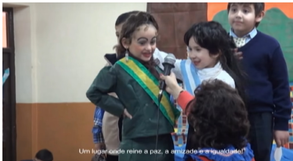
Figura 5: Documentário registra teatro escolar em que meninas argentinas interpretam Dilma Rousseff e Cristina Kirchner.

século XXI, é possível reconhecer que existe de fato um cenário de estabilidade nas relações, representado pela integração e cooperação entre os “países-irmãos”.