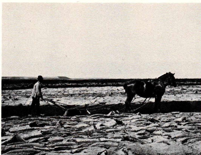
Figur 2. Skrælplojning af afbrændt hede. Gludsted Plantage.

er altså ikke korrekt for landet som helhed. På den anden side bekræfter tallene i tabel 2, at »ikke-lokale« ejere havde en stor andel i arealtilvæksten i hele perioden 1866–1929.