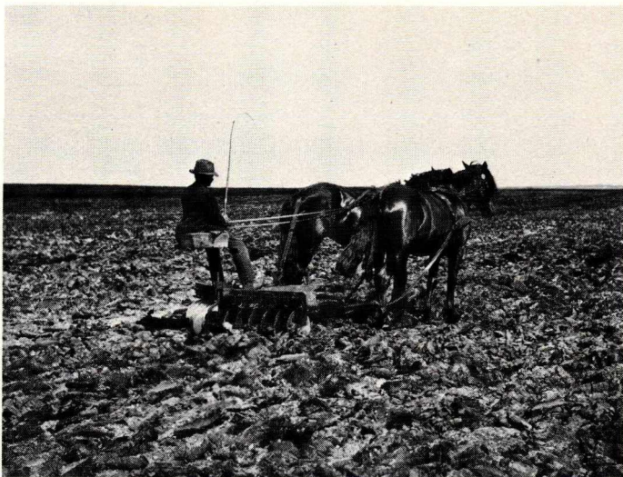
Figur 3. Den skræpløjede hede behandles med tallerkenharve før tilplantning. Gludsted Plantage.