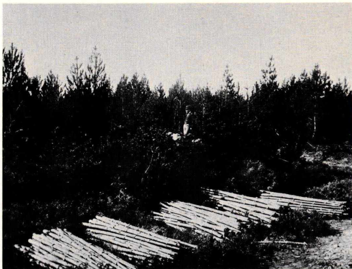
Figur 5. Gavntræ af bjergfyr. Birkebæk Plantage.

antallet af gårde i regionen og en stigning i antallet af huse med jord. Der findes ingen angivelse af, hvor stor en bæredygtig landbrugsejendom på heden er i den periode, men hvis mindstegrænsen sættes ved 18 tdr. ld., har knap 1.000 husmandsfamilier skullet supplere indkomsten ved arbejde for andre. På grundlag af tabel 3 kan det skønnes, at plantagesektoren kunne give deltidsbeskæftigelse til en fjerdedel af det sandsynlige antal arbejdssøgende frem til 1915, hvorefter den teoretiske jobskabelse nok er blevet lidt større relativt set.