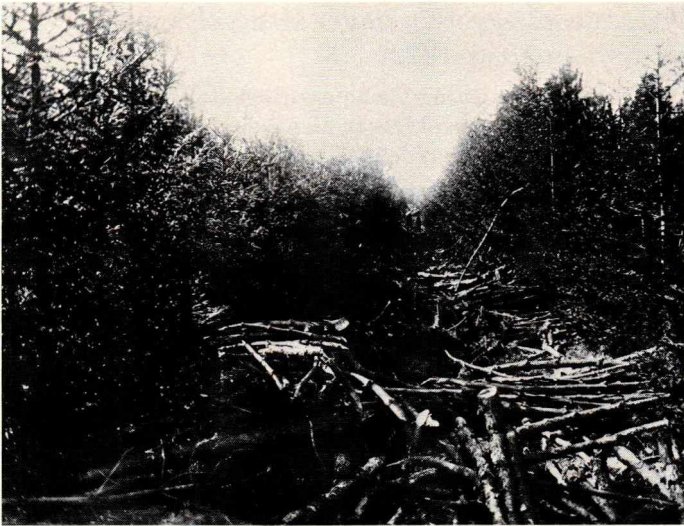
Figur 1. Borthugning af de bjergfyr, der har hjulpet rødgranerne til at vokse op. Birkebæk Plantage.*

det Selskabets Mening, at Tilplantning af disse Arealer direkte og indirekte er til saa stor Fordel for Landet, at Tilplantningen deraf bør fremmes med al Kraft. 17