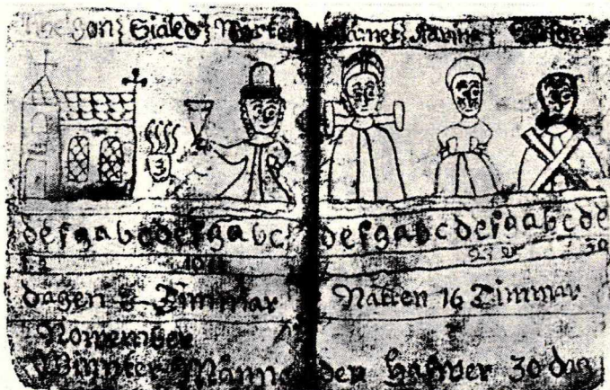
Svensk Bondemanak. Kopi fra Lebech. Findes også i S. Svensson: Bondens år (Stockholm 1972)

som den nordsjællandske præst Joachim Junge udtrykte det i slutningen af 1700-tallet. 1