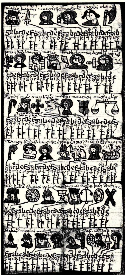
Billedkalender fra 1513 (Det kgl. Bibliotek). Kopi fra Lebech.