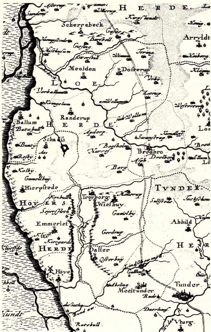
Udsnit af Johannes Mejers kort over den vestlige del af Haderslev amt samt Ribe og Løgumkloster fra 1652.