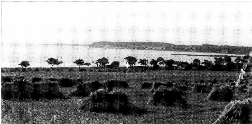
Høstmarker ved Kertemindebugten.

Endelig nåede vi frem til høstens store arbejdsopgaver. Det var et imponerende syn, når vi kørte med 10 selvbindere efter hinanden op og ned af de store bakker med Tissøens blinkende overflade i det fjerne. (-)