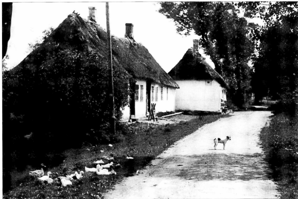
Idyl ved landsbyens gadekær. Hindsholm.

avlslære og gødningslære var så absolut de fag, der havde min største interesse. (-) Regnskabslære fik også min store opmærksomhed. En del af mine gamle lærebøger fra landbrugsskoletiden står endnu på min reol, selv om de forlængst er blevet forældede. Men en enkelt bog fra den tid står der stadig og er lige aktuel. Det er Højskolesangbogen.