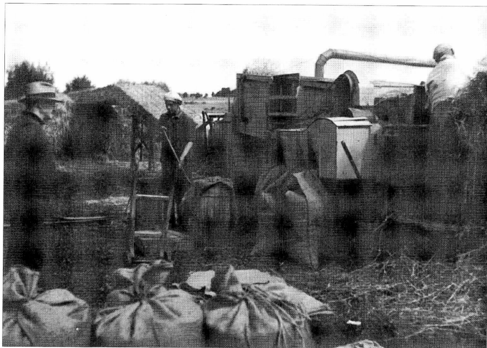
Der tærskes på Hverringe gods ved Kerteminde.

get bedre jord. Der var en kobesætning på 35 køer af blandet race plus opdræt. Ca. 10 grisesøer og eget ornehold samt plads til en del fedesvin. Desuden 10 heste, men ingen traktor. Der var foruden mig en gift fodermester og en ung pige på ca. 18 år. Hun serverede kaffe for mig den dag, jeg fik pladsen. Manden mente, jeg skulle hilse på hende med det samme. Det blev så min "skæbne" eller vores, idet hun har været min kone lige siden.