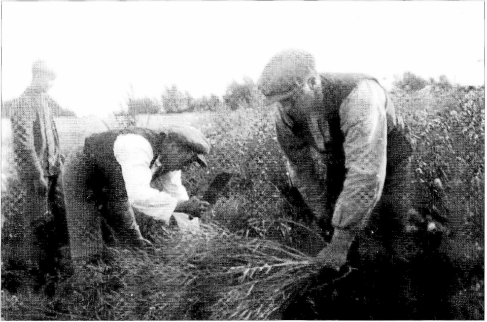
Der høstes raps.

gård. Vi havde fem arbejdsheste, 16 køer og ca. 30 ungkreaturer, og da var det blevet nemmere med hegn, da havde vi fået de første elhegn. Det var batterihegn, som ikke var så effektive som de hegn, vi får i dag, men trods alt en stor lettelse ved at lave indhegning. Jeg var forkarl, så havde vi en ung andenkarl og en pige, der hjalp både ude og inde. Det var en frisk mand, som søgte at gøre os interesserede i driften, og han var heller ikke bange for at tage os med på råd. Det var jo ikke alle steder, det var ønsket, at man blandede sig i dispositionen. (-)