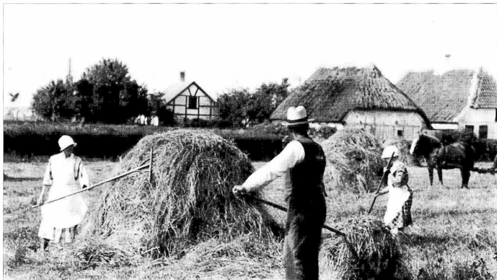
Høet rives sammen og sættes i stak.

straks købt gummivogn, så staldgødningen spredte vi direkte fra vognen, og når vi havde et par meter på hver side, kunne vi jo pløje gødningen ned for at mindske tabet. Det var jo rart, når vi kom til foråret, hvis gødningen var udkørt. At harve og så tog jo ikke lang tid; men vi havde jo selvfølgelig også det daglige staldarbejde ved siden af. Det tog jo et par timer morgen og aften. Når roerne så var sået, skulle vi jo gerne snart til at rense i dem, for der var jo ingen kemiske midler til at holde dem rene med, så det var med radrenser og roehakke, så der var meget håndarbejdede dengang. Midten af juni skulle vi gerne være færdige med roerne første gang, for så