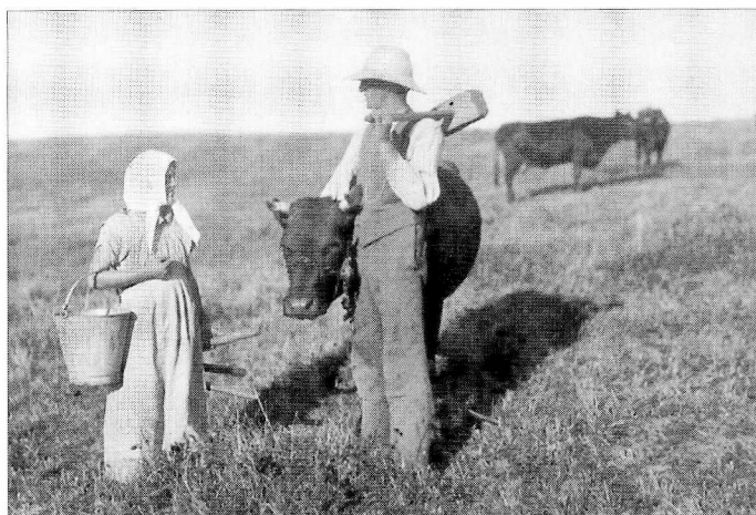
Med tøjrekøllen over skulderen er der plads til en sludder med malkepigen. Det kunne være et husmandspar.

1. oktober var byggeriet færdigt, så vi kunne flytte ind på loftet. Komfur og kakkellovn havde vi endnu ikke fået, så jeg lavede mad på primus. Til min fødselsdag i oktober kom der jo gæster,