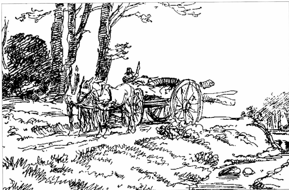
J. Th. Lundbye: Brændekørsel i Udkanten af en Skov, 1848. Denne sjællandske bonde kører brænde fra skoven med heste. I Silkeborgskovene foregik det tunge arbejde med at køre brændet fra skovene til ladepladserne ved åen og søerne med stude.

1805 og 1806, ville fredskovsforordningen af 27. september 1805, med dens begrænsninger på de nye skovejeres muligheder for at udnytte deres skove, ikke udgøre nogen trussel mod Ingerslev. Når den alligevel blev opfattet som en sådan, skyldtes det naturligvis, at det var hans hensigt at udnytte skovene på en helt anden måde.