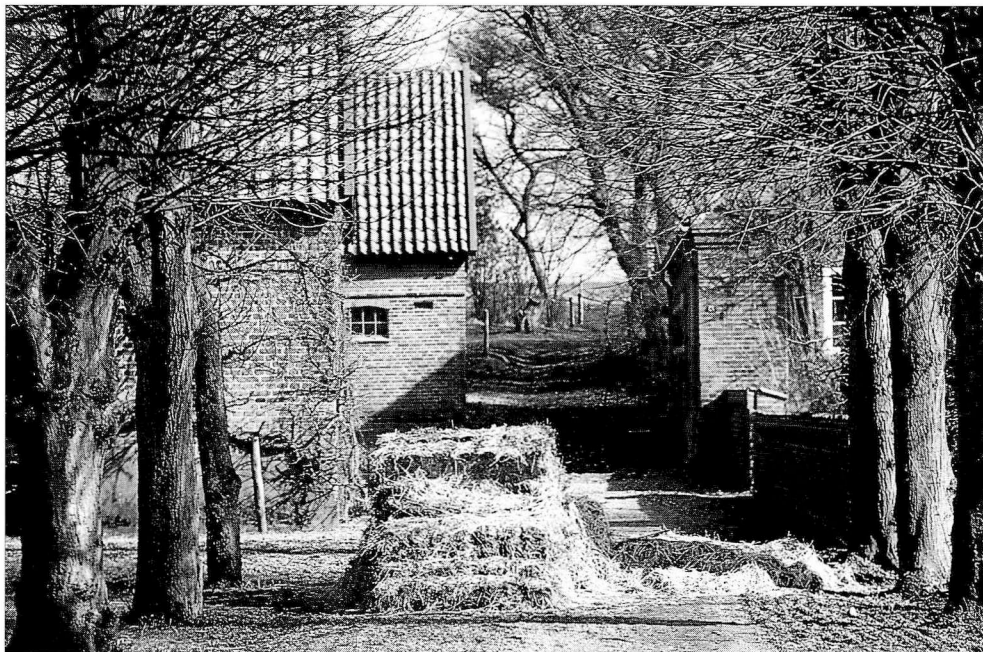
Landbrugets Græsrødder skabte megen presseomtale ved en aktion den 25. 3. 1993 rundt om i landet, hvor en række politikere fik væltet en halmballe af foran deres bopæl. Her er det gået ud over landbrugsminister Bjørn Westh.

Det blev dog kun til enkelte aktioner, hvor den mest mediedækkede blev placeringen af store halmballer uden for en række politikeres bopæl. Men aktionen viste også at det langt fra