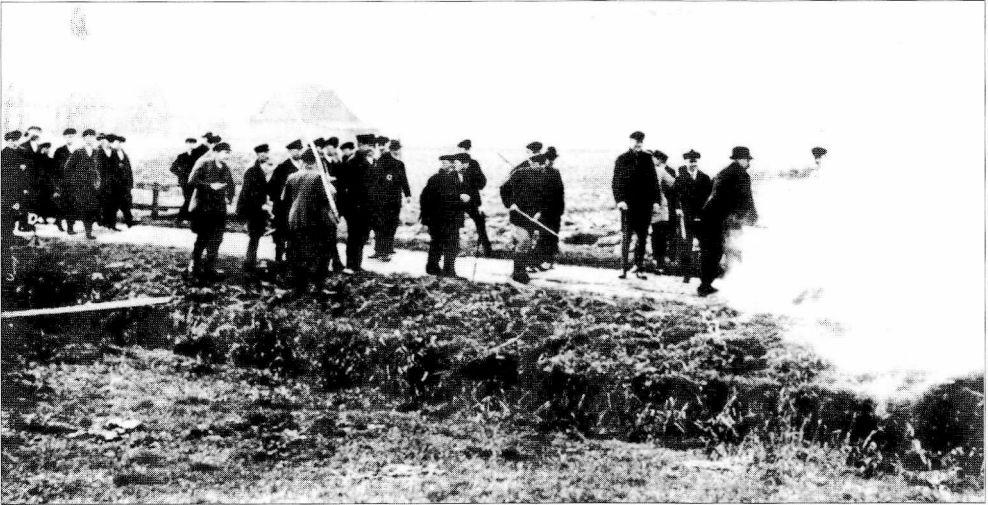
Protesterende slesvig-holstenske bønder afbrænder halm i Beidenfleth den 19. november 1928. Efter postkort fremstillet af Landvolkbevægelsen.

fleth (Kreis Steinburg) skulle der tages en okse i pant til dækning af skyldige kommuneskatter. Den 19. november 1928 mødte kommunens repræsentant frem for at gennemføre udpantningen; men talrige naboer havde da forsamlet sig, og med trusler og afbrænding af halmbål fik de forhindret, at dyrene forlod gården. Succes'en var begrænset: kort efter blev okserne afhentet af et opbud af politi, som ikke havde kunnet overvindes uden massiv vold. Umiddelbart herpå kom det til et protestmøde i Itzehoe med deltagelse af over tusinde bønder, og allerede tre dage senere stod de to okser igen på deres gårde i Beidenfleth: deres salg på Hamburgs kvægmærked var blevet forhindret af vrede bønder.